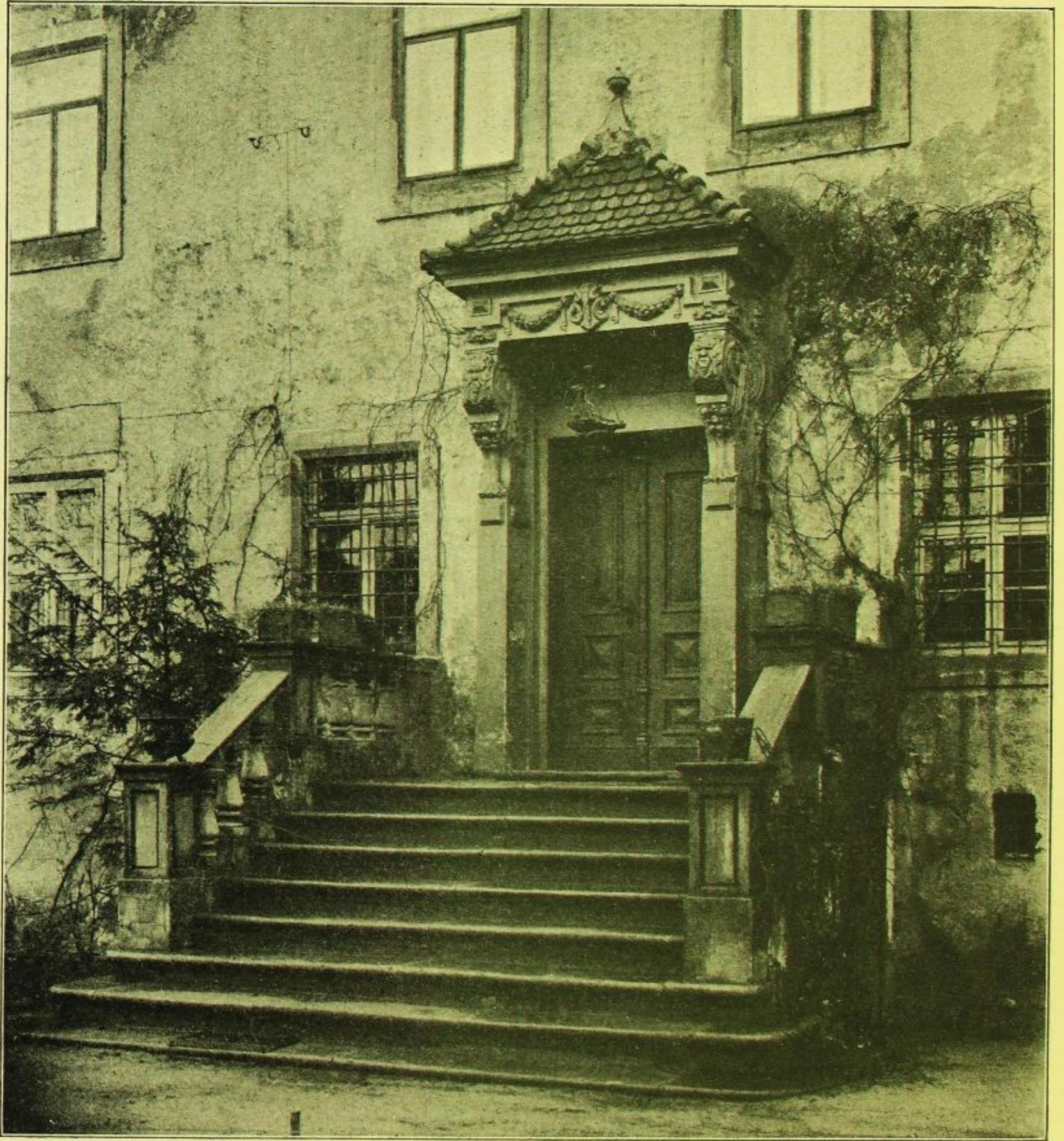
Fig. 358. Sacka, Herrenhaus. Haustor.

Die andere Wetterfahne auf dem Westgiebel ist bez.: OB / 1858. Mit bezug auf den Gutsbesitzer Oskar Bartcky (1854—60).