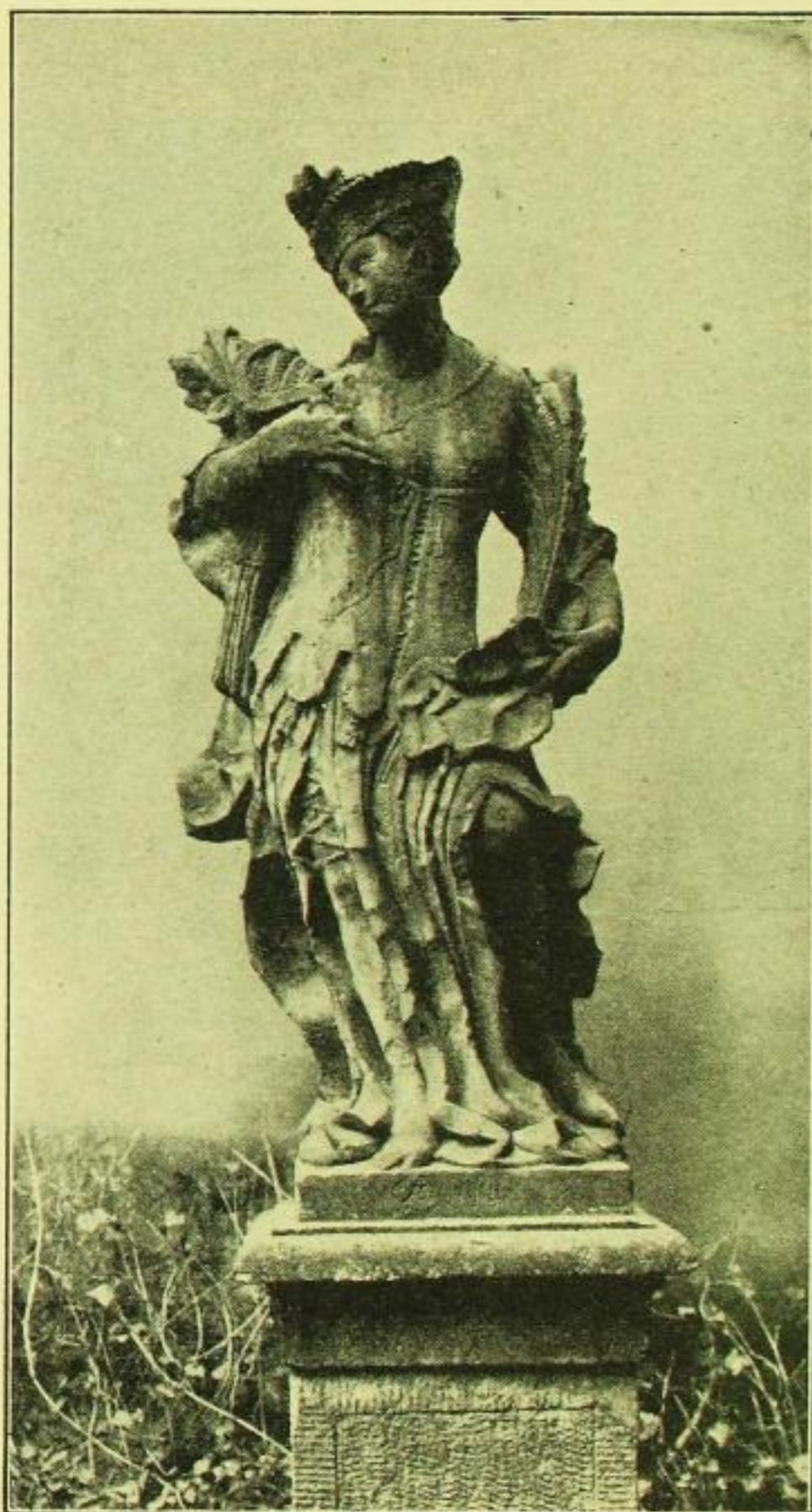
Fig. 411. Seußlitz, Schloß, Standbild.

Beide bezeichneten Bilder haben bei guter Charakteristik solid handwerksmäßige Malweise.