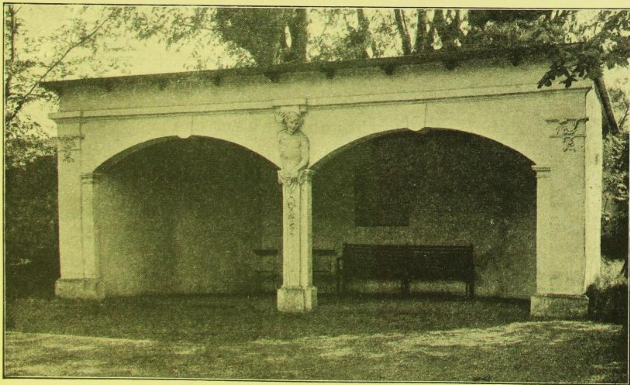
Fig. 437. Skassa, Schloß, Gartenhaus.