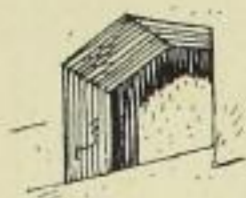
Fig. 593. Nische.

In der Westmauer des südlichen Querhausflügels befindet sich über dem Ostfenster der Achteckkapelle eine im Schildgiebelartig geschlossene, nebenstehend dargestellte Nische (Fig. 593).