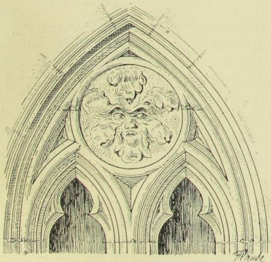
Fig. 595. Dom, Westfenster im Untergeschoß des Nordwestturmes, Maßwerk.

Das Westfenster der Kapelle im ersten Geschoß des Nordteiles des Westturmes ist in ähnlicher Weise ausgebildet wie Fig. 222, jedoch füllt den Maßwerkkreis oberhalb der beiden Spitzbögen eine Scheibe, die nach außen mit einem Kopf und aus diesem hervorspringenden Blattwerk in Relief verziert ist (Fig. 595 und 596). Am Gewände die untenstehenden Steinmetzzeichen, von denen das Kreuz undeutlich ist.