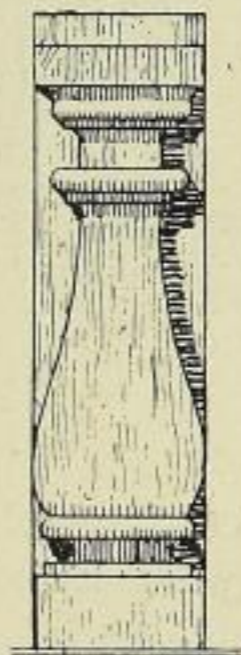
Fig. 77. Leuben, Dockenbrüstung.

Das Denkmal stammt aus der Frauenkirche zu Dresden und ist Heft XXI, Seite 66 besprochen; es wurde 1876 auf dem Leubener Kirchhof aufgefunden, 1877