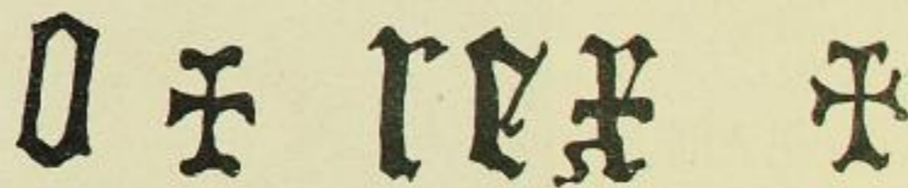
Fig. 290. Wallroda, Inschrift der kleinen Glocke.