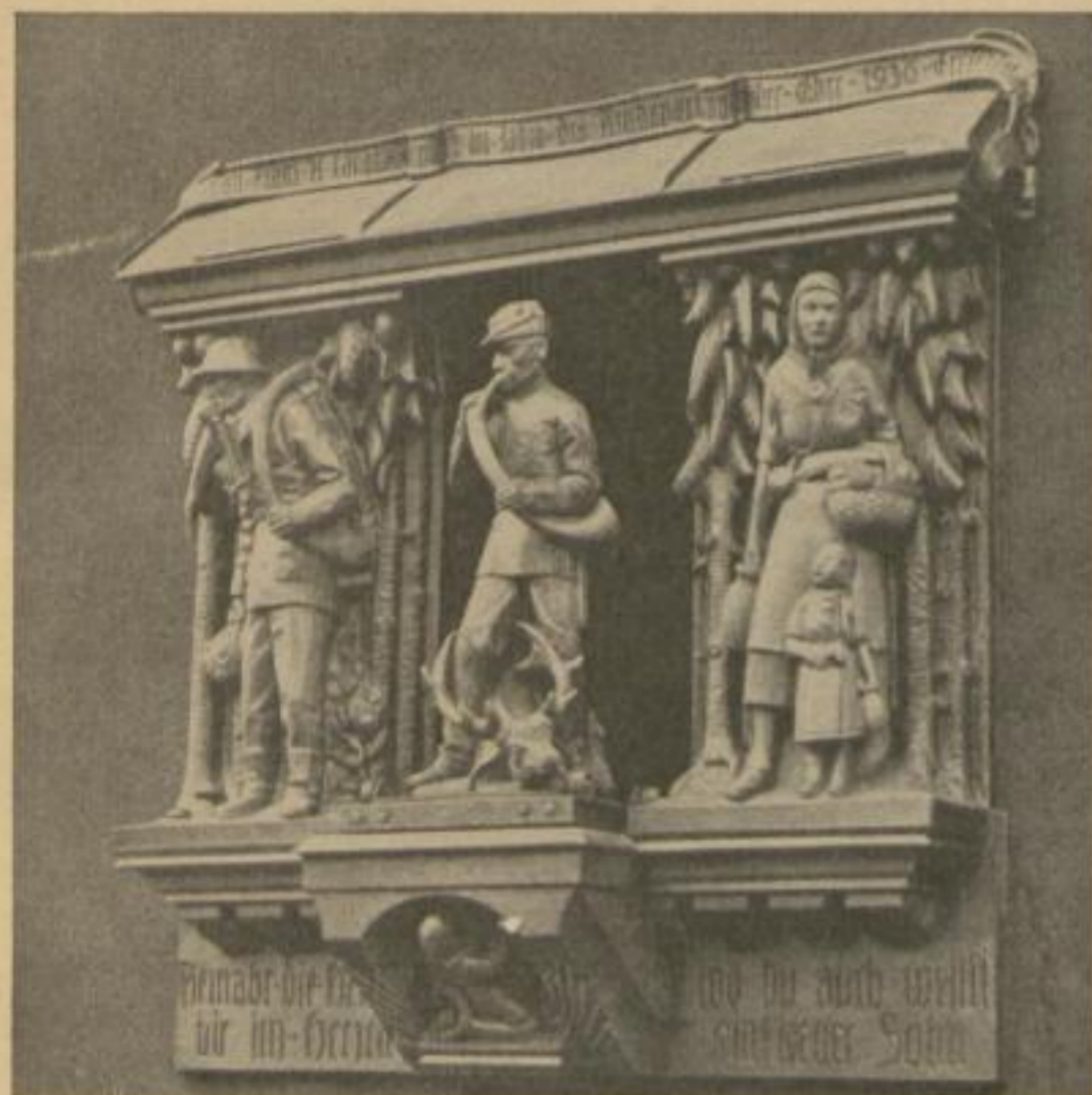
10 Uhr: Glockenspiel: „Im Wald und auf der Heide“ Orgelspiel: Jagdrufe (heraustretender Jäger) Glockenspiel: „Wie herrlich ist's im Wald“