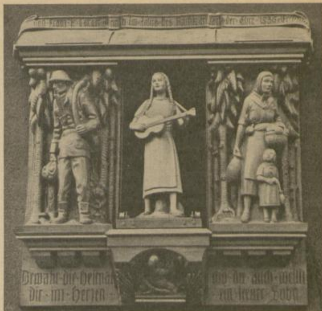
12 Uhr: Glockenspiel: „Du de Wälder hamlich rauschen“ Orgelspiel: „Vogelbeerbaum“ (heraustretendes erzgeb. Mädel) Glockenspiel: „Grüß dich Gott, o du mei Erzgebarg“

bisher streng abgetrennten Grüngürteln, die einen großen Teil des Weichbildes von Chemnitz umsäumen.