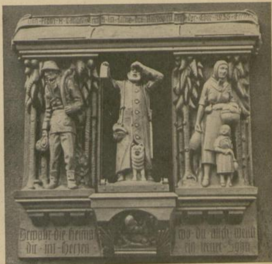
22 Uhr: Glockenspiel: „Nachtwächterlied“ Orgelspiel: Nachtwächterlied aus den „Meisterfingern“ (heraustretender Nachtwächter) Glockenspiel: „Der Mond ist aufgegangen“