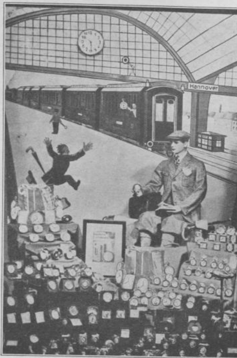
Reiseuhren-Spezialfenster mit lebendigem Hintergrund und Wachsfigur (Dekoration Sander jun., Hannover)

Sehen Sie sich einmal das Reiseuhren-Schaufenster des Kollegen Sander in Hannover an, dessen Dekoration von Sander jun. ausgeführt ist. Atmet es nicht Jugend, Humor und Sinn für Reklame? Ist nicht die lustige Darstellung des Schaufensterhintergrundes mit dem abfahrenden Zug im Hauptbahnhof Hannover, die Benutzung einer Wachsfigur