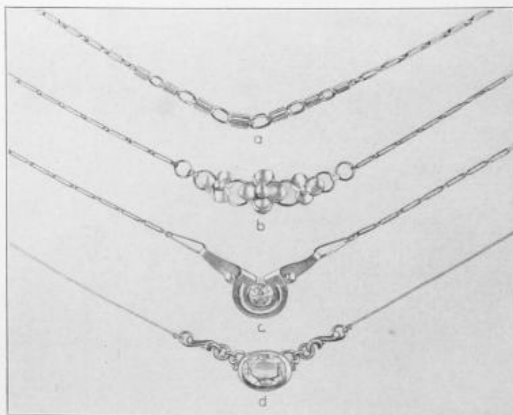
Abb. 18. Behangkolliers. a) Silber 835/— (8 RM) — b) Silber 835/— (8 RM) — c) Silber 835/— mit hellblauem Stein (12 RM) — d) Vergoldet mit hellblauem Stein (5 RM)