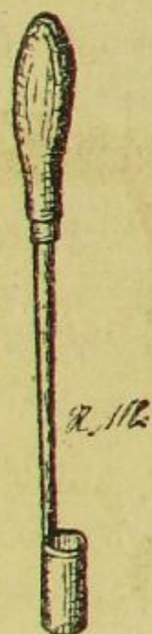
Fig. 3. Kernhausbohrer.

Der Kernhausbohrer oder Apfelfentkerner besteht, wie Fig. 3 zeigt, aus einem unten scharfen, röhrenförmigen Messer von angemessener Weite, welches nach oben in einen hölzernen Griff ausläuft. Mit diesem wird das Kerngehäuse der ge-