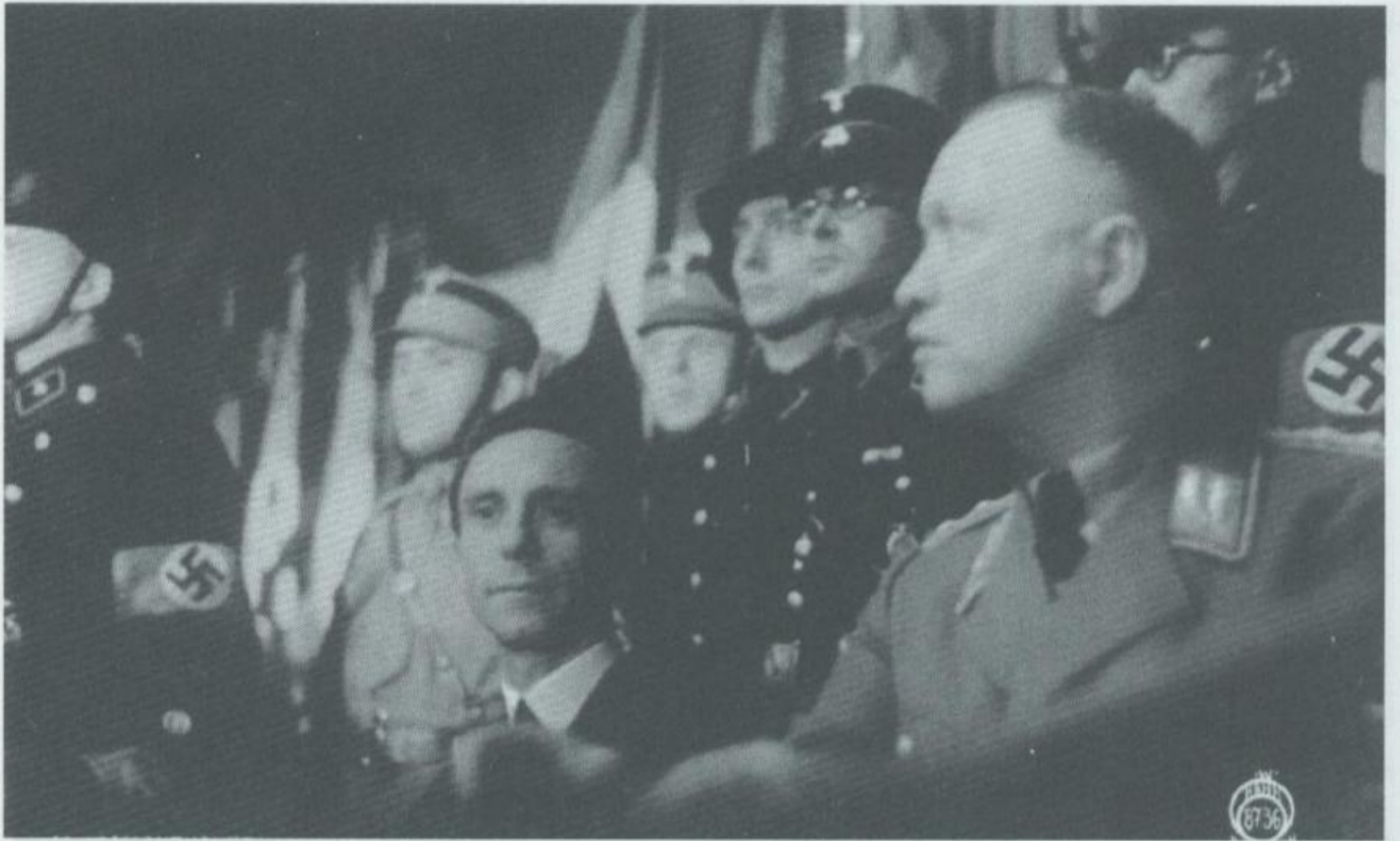
Goebbels und Martin Mutschmann, der »Reichsstatthalter für Sachsen«, bei einer Propagandaveranstaltung in Dresden um 1934