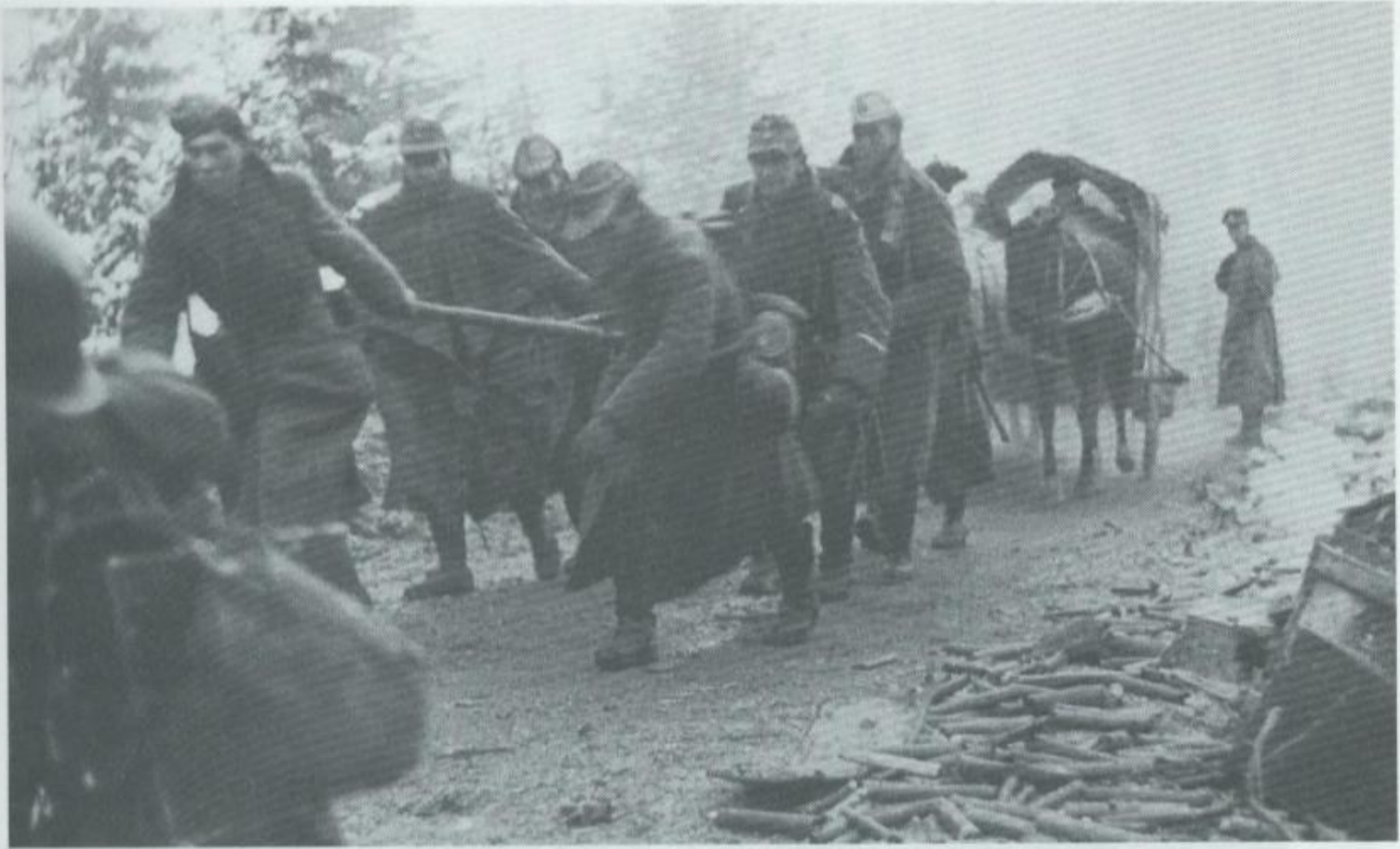
Deutsche Wehrmacht auf dem Rückzug