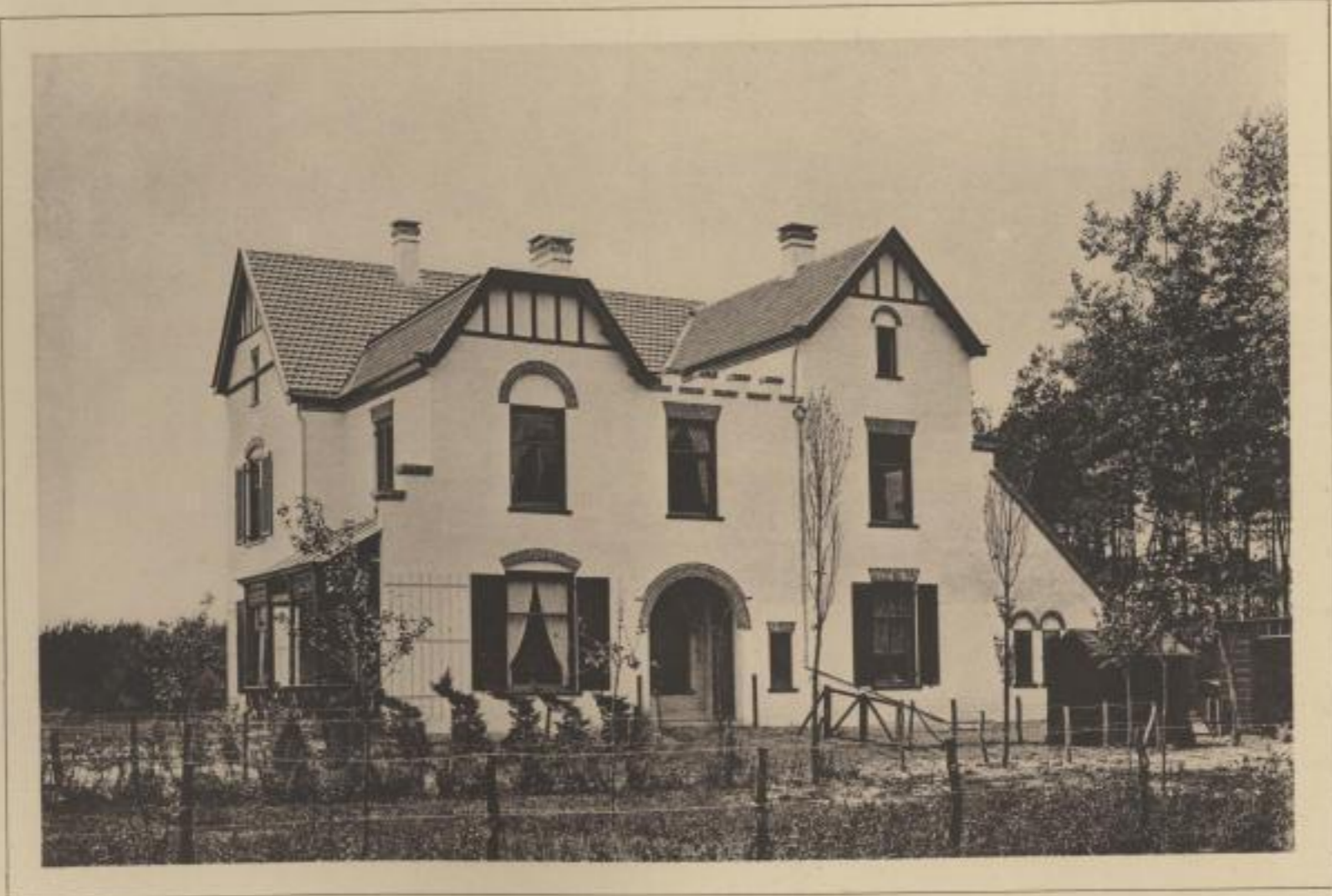
Ansicht gegen Norden.