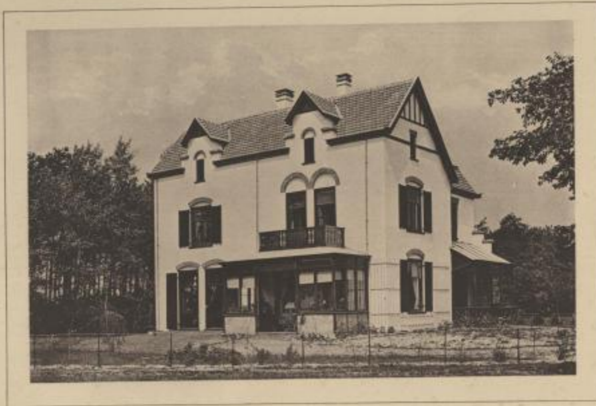
Ansicht gegen Süden.

Herstellungskosten: 17 800 M. d. i. pr. qm: 108 M. pr. kubm: 14 M.