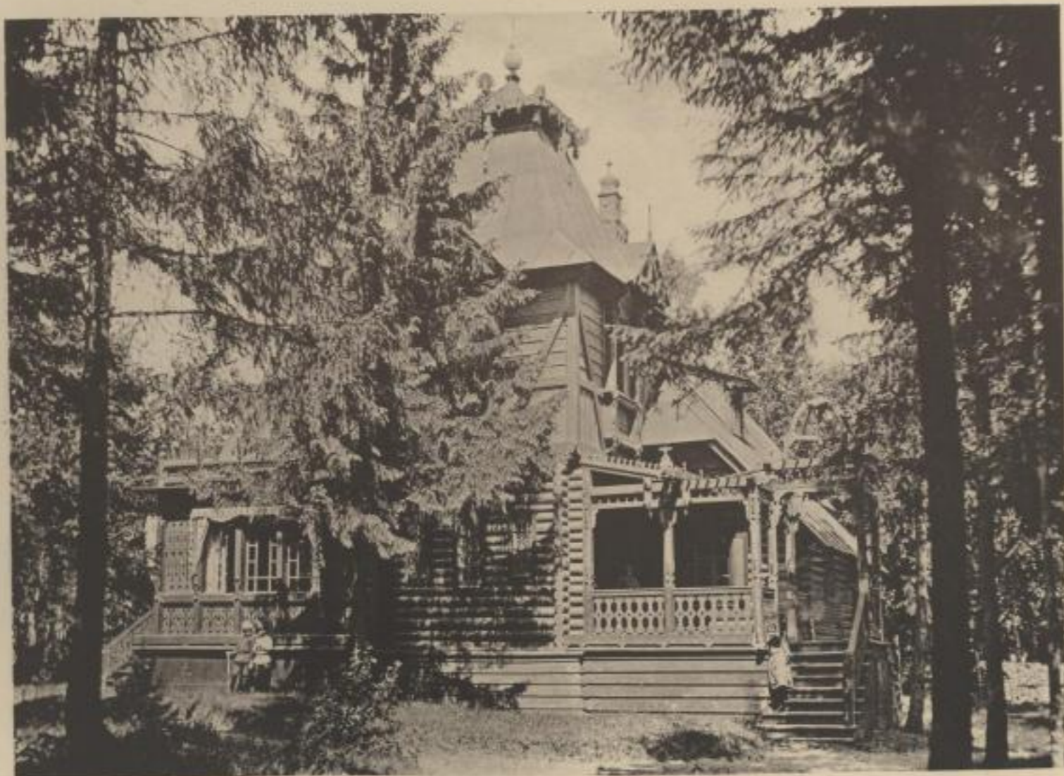
Ansicht nach der Hauptstrasse.