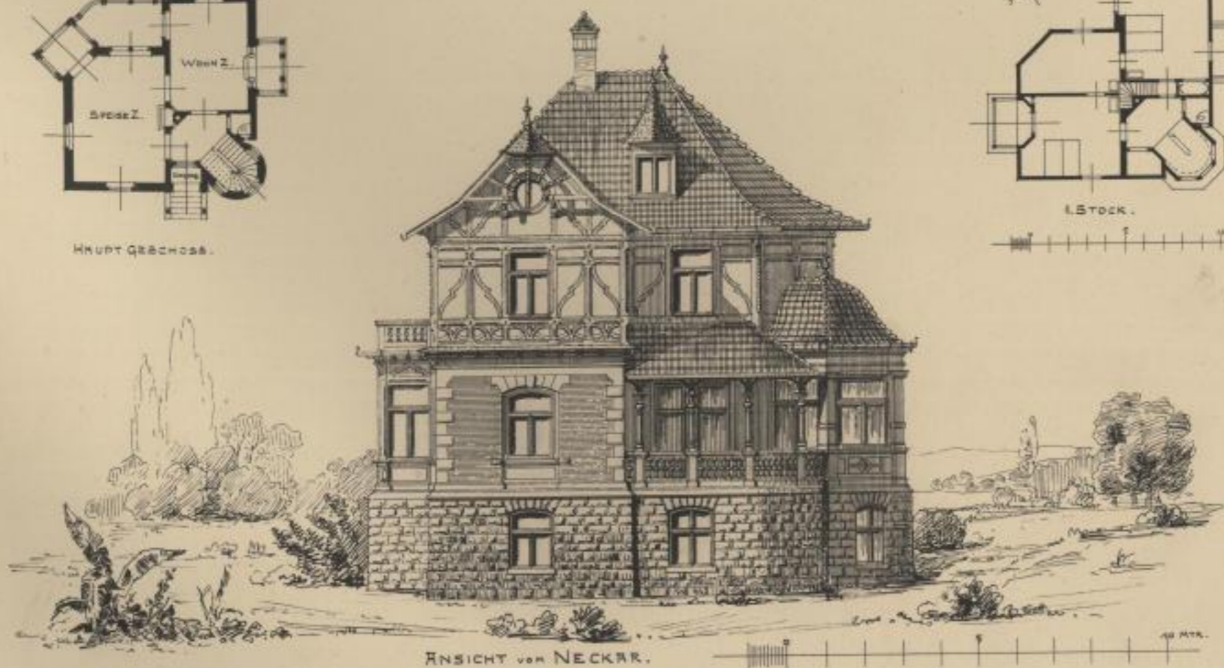
ANSICHT VON NECKAR.