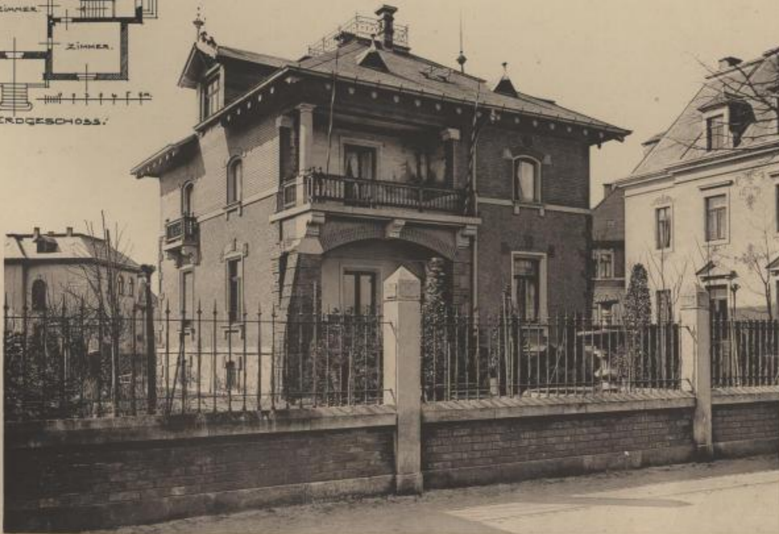
Architekt: Friedrich Flügge, Dresden.