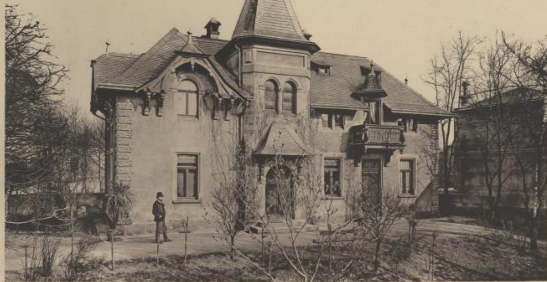
Architekt: Wilhelm Barth, Dresden.