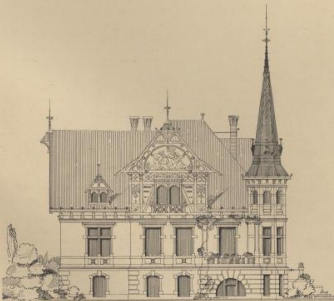
Ansicht u. d. Folkwitzer-Strasse.