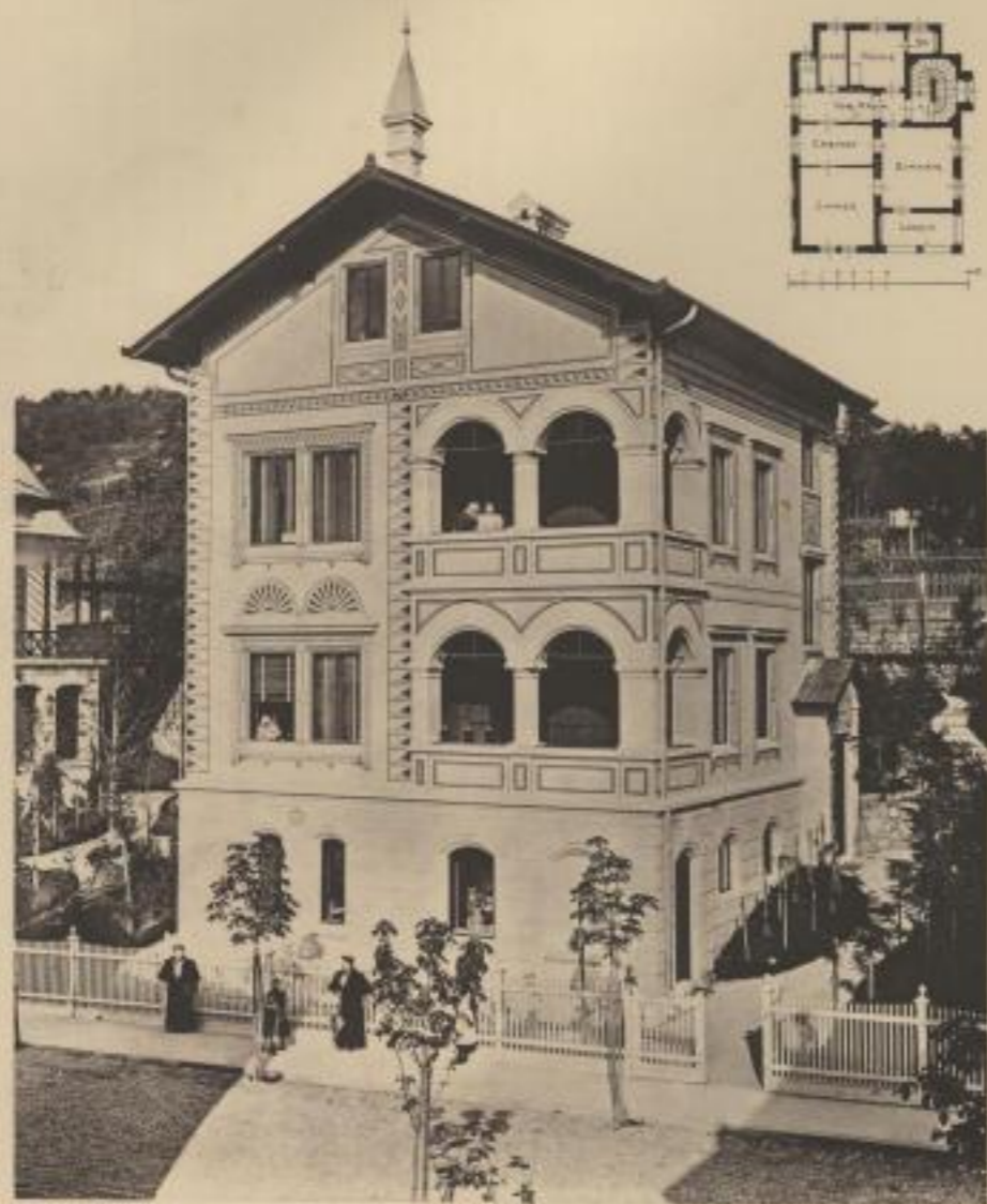
Architekt: Hofbaumeister Franz X. Schroll, Heide 1. Wien.