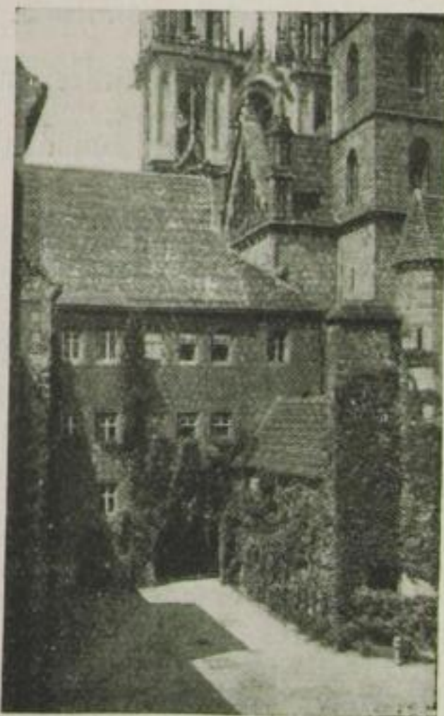
Hof des Amtsgerichts

2 2 Bes. Freies Hochstift Meissen. Domkirche. [Amtsstufen.]