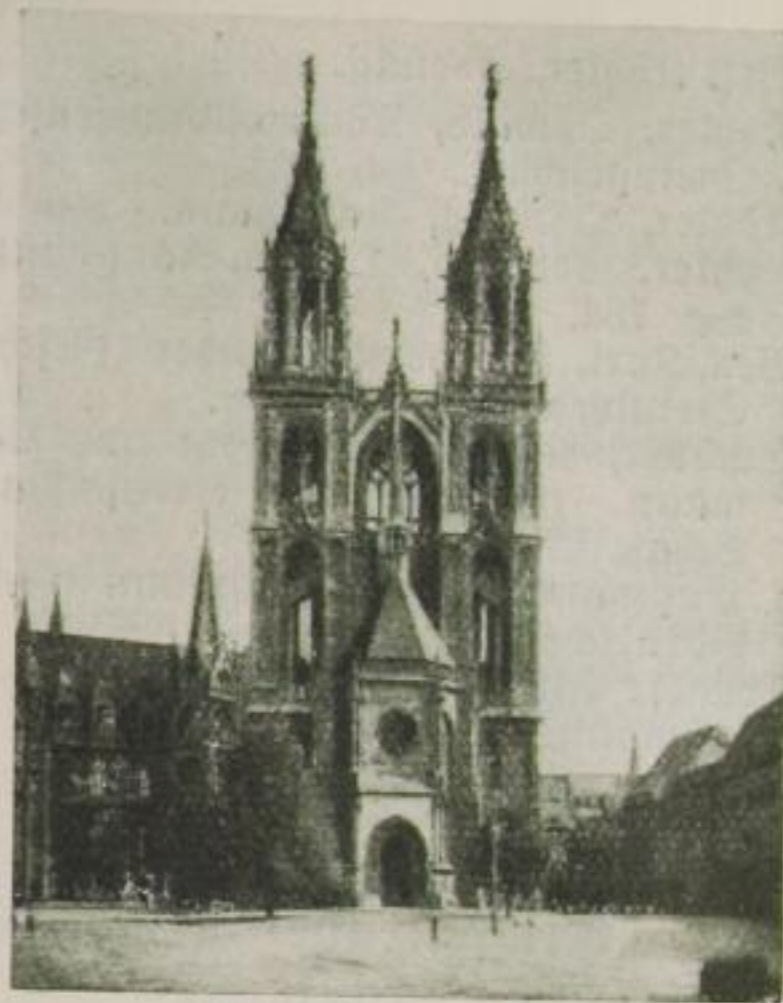
Westansicht des Domes