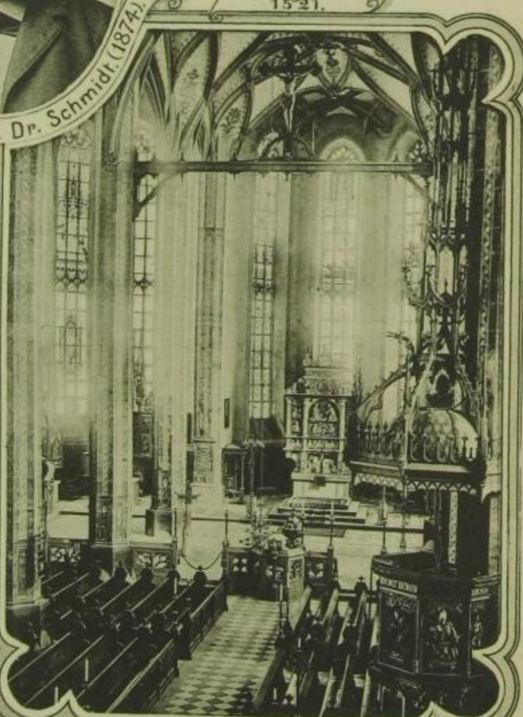
Blick nach dem Hauptaltar. 1882-1884 erneut.