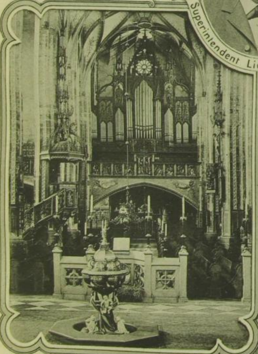
Blick nach der Orgel. 1895 vollendet.