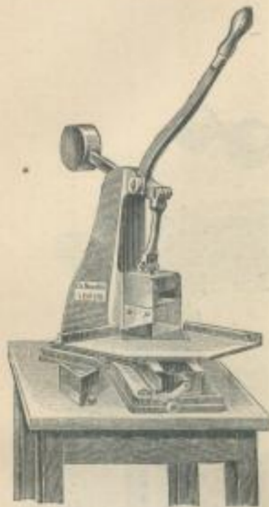
Fig. 15. Eckenausstossmaschine von CHN. MANSFELD.

durch Fussbetrieb. Dies Maschinchen dient vorzüglich bei der Herstellung feinerer Karten (Klappkarten) und einfacher Cartonnagen. Im ersteren Falle bedient man sich zweier Gummiführungsrollen. Inclusive dieser, zweier Ritzapparate und eines Quereinführwinkels kostet die Maschine nur 190 \mathcal{M} . DIETZ & LISTING fertigen für ähnliche Arbeiten einen in Fig. 14