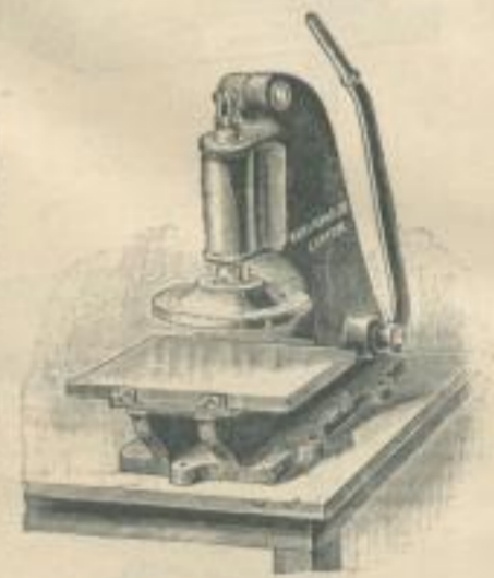
Fig. 16. Kleine Stanzpresse von KARL KRAUSE.

abgebildeten Handritzapparat an, welcher gern gekauft wird, denn er kostet bei 40 cm Ritzlänge nur 50 \mathcal{M} und ist bei kleineren Partien von grossem Vorteil.