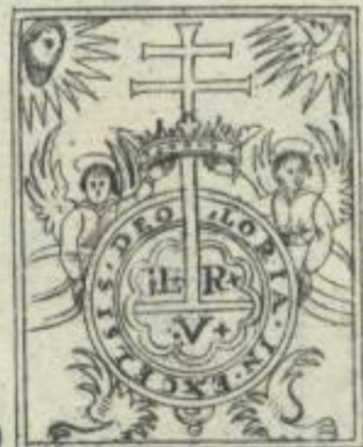
M. Laurentius de Rubeis de Valentia Ferrariae A. 1497.