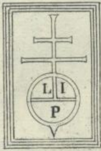
Lazarus de Sauliano. Venetijs, A. 1492.