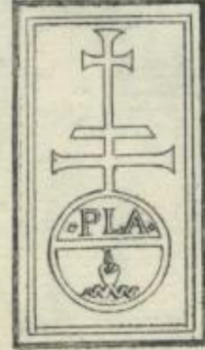
Plato de Benedictis Bononiensis. Bononiae A. 1498.