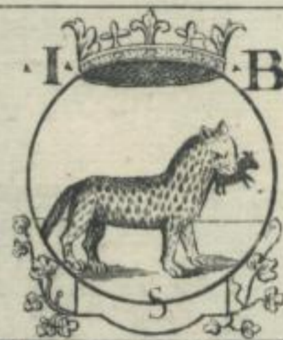
Ioh. Baptista Seffa, Venetis. 1502.