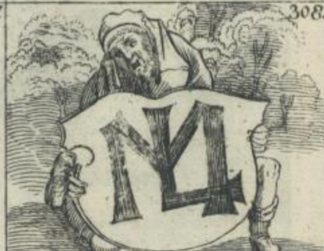
Melchior Lotter, Lipsiae. 1512.