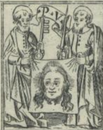
Iohannes de Platea, Lugduni. 1514.