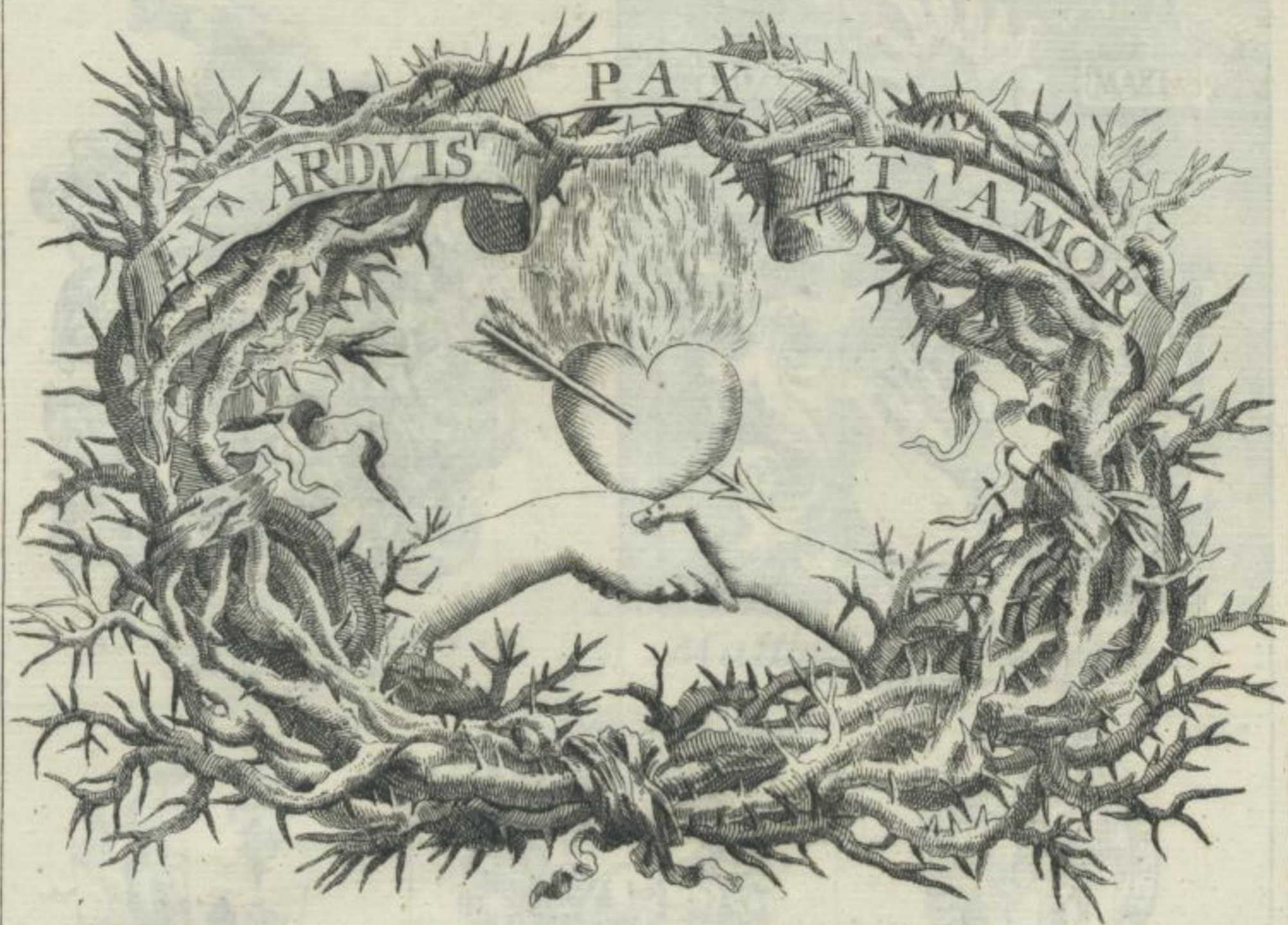
Ludovicus Billaini, Parisiis, 1681.