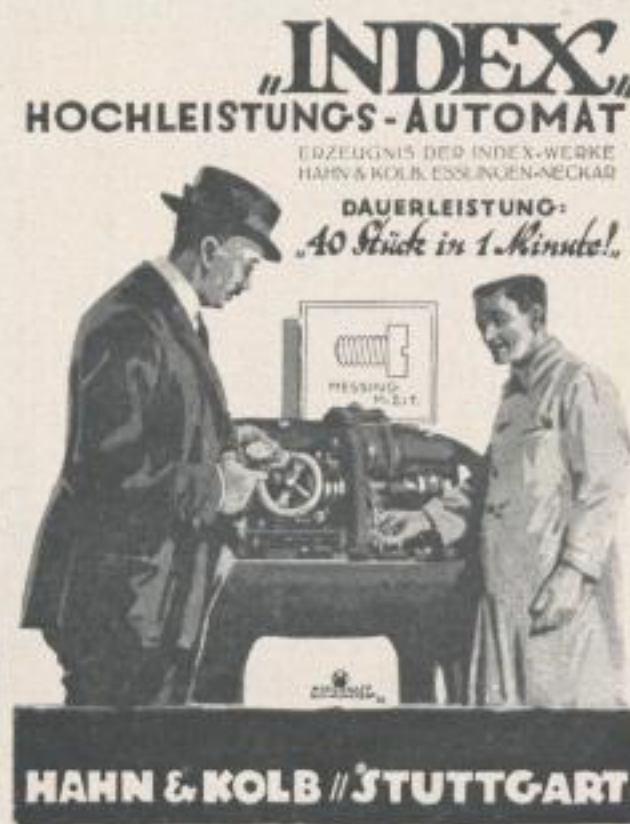
Anzeige (ganze Seite)