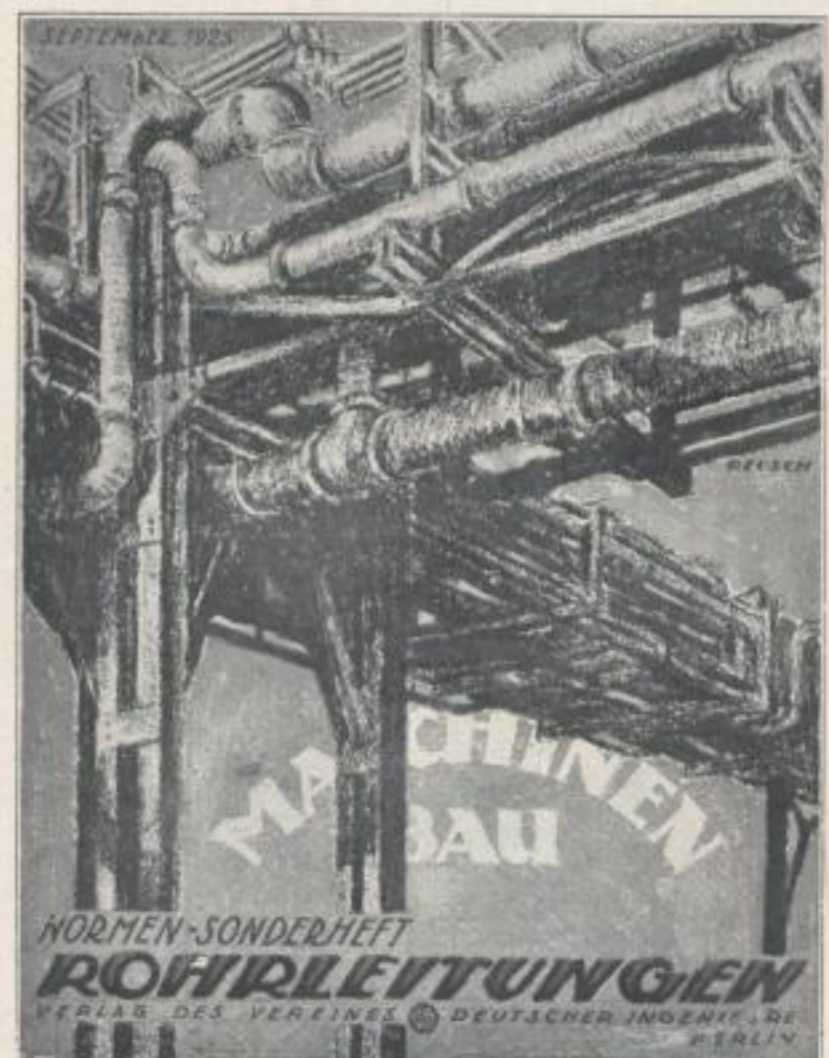
Titelzeichnung eines Sonderheftes »Rohrleitungen« für den Verlag des Vereins Deutscher Ingenieure