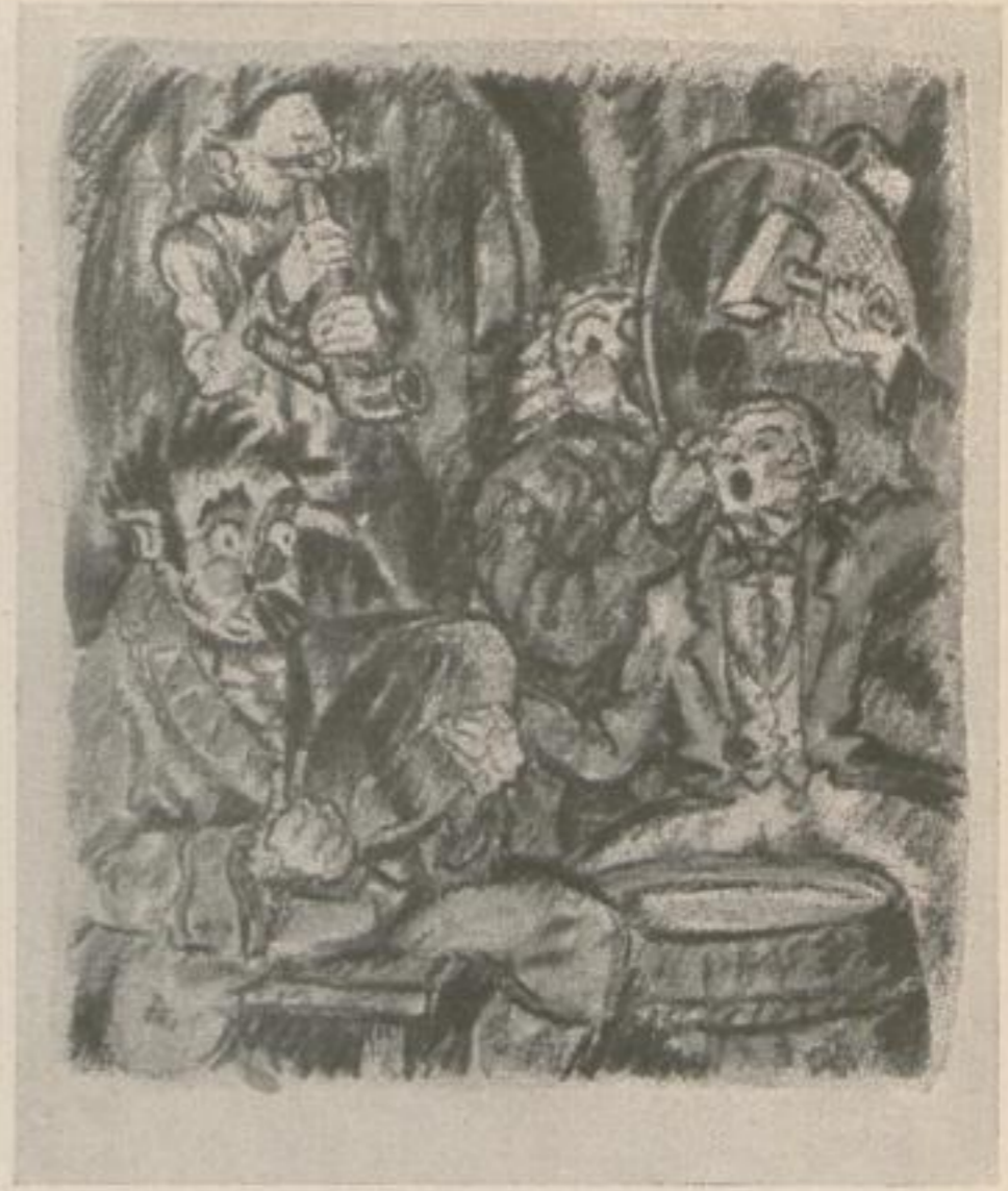
WILHELM HAUFF / PHANTASIEN IM BREMER RATSKELLER / ROESL & CO. VERLAG ILLUSTRATIONEN VON HUGO WILKENS