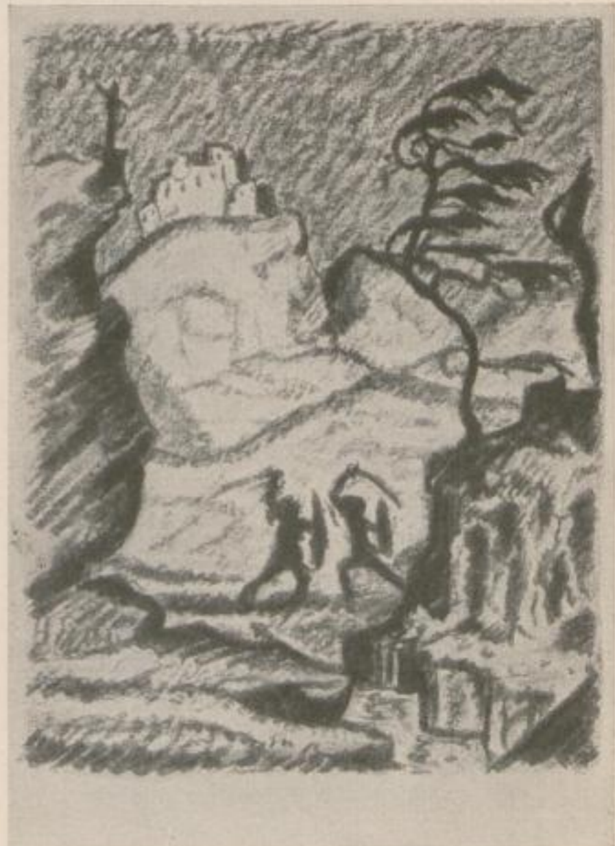
HEINRICH HEINE / BUCH DER LIEDER ROESL & CO. VERLAG