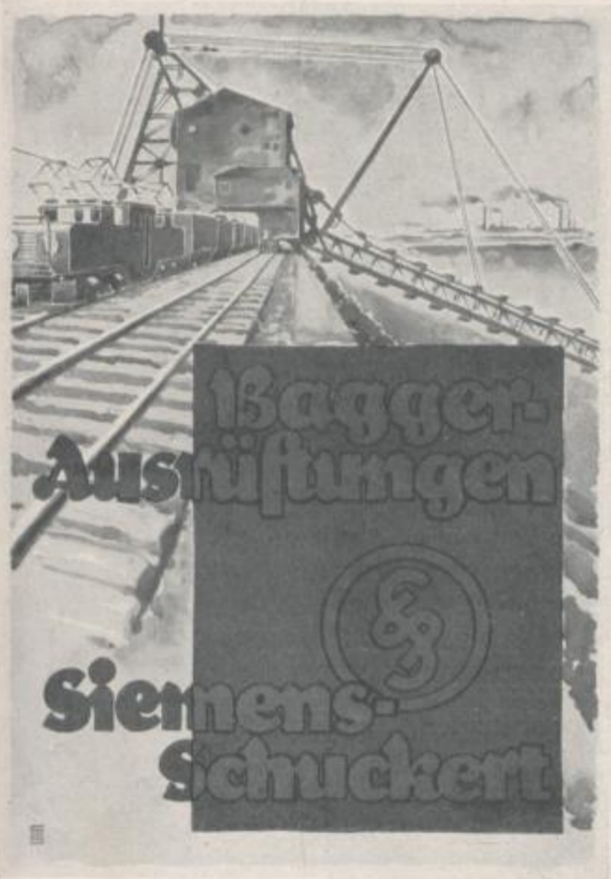
ERNST SEMMLER / BERLIN