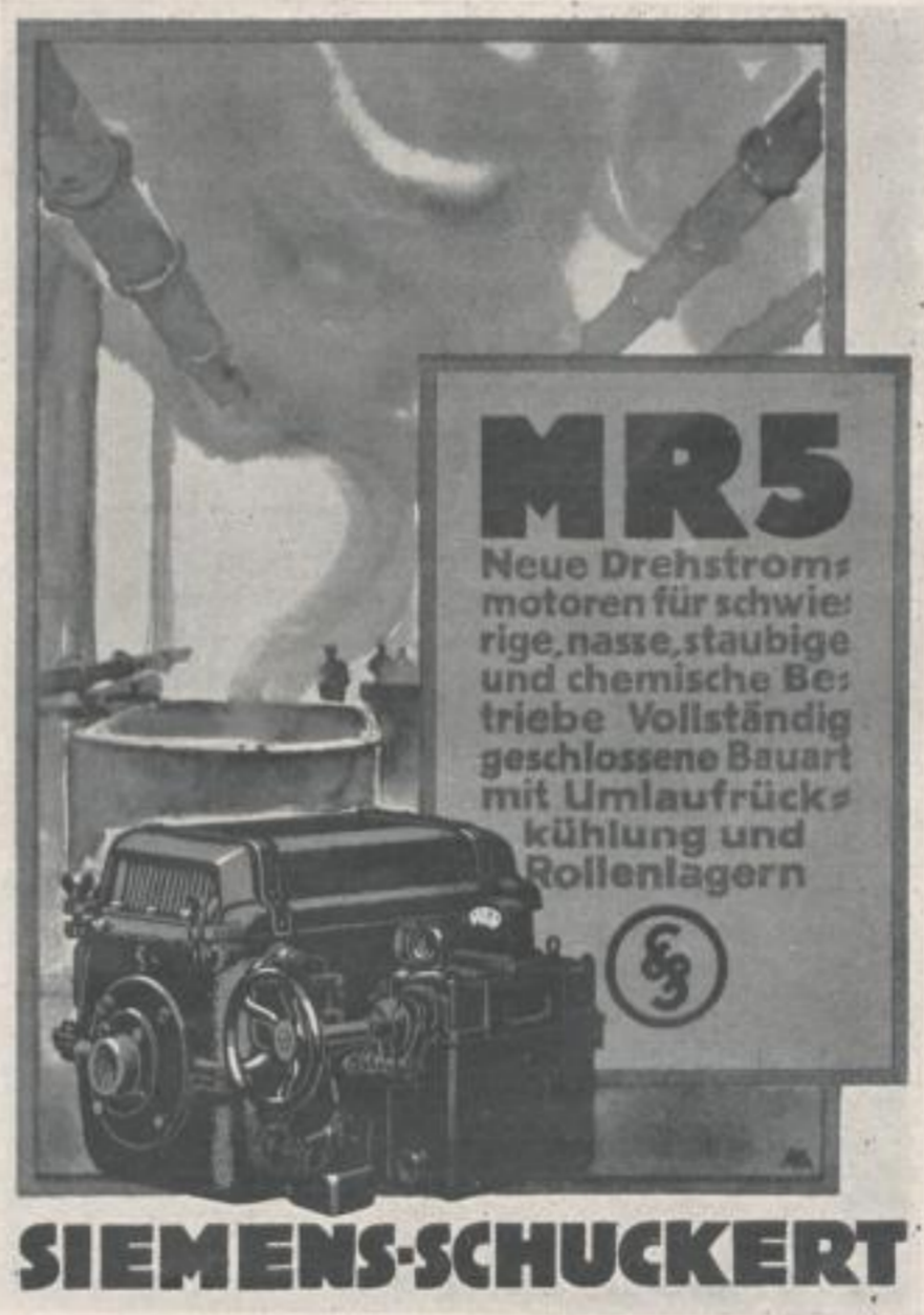
RUDOLF ALLNER / BERLIN