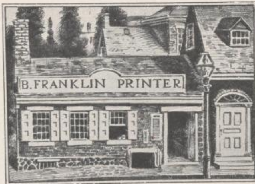
Benjamin Franklins Druckerei in Philadelphia (nach einer alten amerikanischen Zeichnung)

Franklin war der erste, der die Reklame, die jetzt ein unentbehrlicher Bestandteil des Wirtschaftslebens ist, weitgehend nutzbar zu machen wußte. Franklin erfand eine Kopierpresse, um Briefe und andere Schriftstücke kopieren zu können.