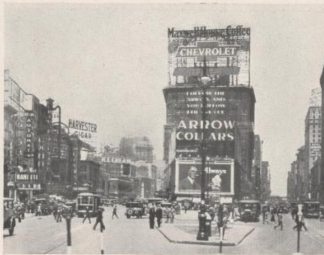
Broadway und 7. Avenue am Sonntag ohne Verkehr

Selbst in den Zeiten des tollsten Verkehrs, wenn die Untergrundbahnen vollgestopft sind wie die Heringsfässer, wird man niemals ein unliebenswürdiges Wort hören, jeder nimmt Rücksicht auf den andern. New York nimmt ja sicher im Rahmen Amerikas auch noch eine Ausnahmestellung ein: Wenn ich also hier in bezug auf die Zuvorkommenheit der Frau gegenüber eine Einschränkung mache, so kann es immerhin sein, daß das nur auf New York zutrifft, nämlich: in der Untergrundbahn denkt niemand daran, einer Dame einen Sitzplatz anzubieten. Auch die Gewohnheit, daß alle Männer