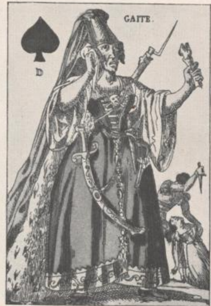
Satire auf das Theater, (Frankreich, 1. Hälfte des 19. Jahrhunderts)

humoristischen Kartenspielen keinen sehr großen Erfolg hatten. Jedenfalls werden sie immer seltener, und neue Ideen tauchen nicht mehr auf. — In Deutschland hatte das Interesse an Kartenspielen, die von der üblichen Form abwichen, bereits früher aufgehört. Und selbst die Ereignisse anno 1848 wurden von keiner Seite zu Verunglimpfungen des Gegners in Kartenspielen ausgewertet.