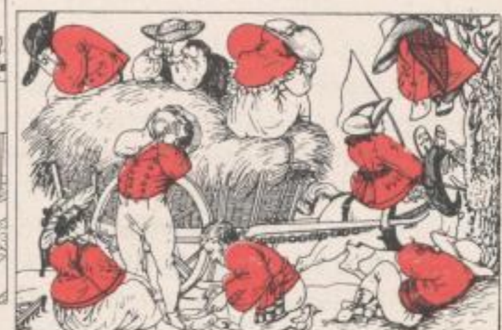
Humoristisches Kartenspiel, gezeichnet von Hauptmann Louis Athalin (Sammlung Graf de Rochembeau)