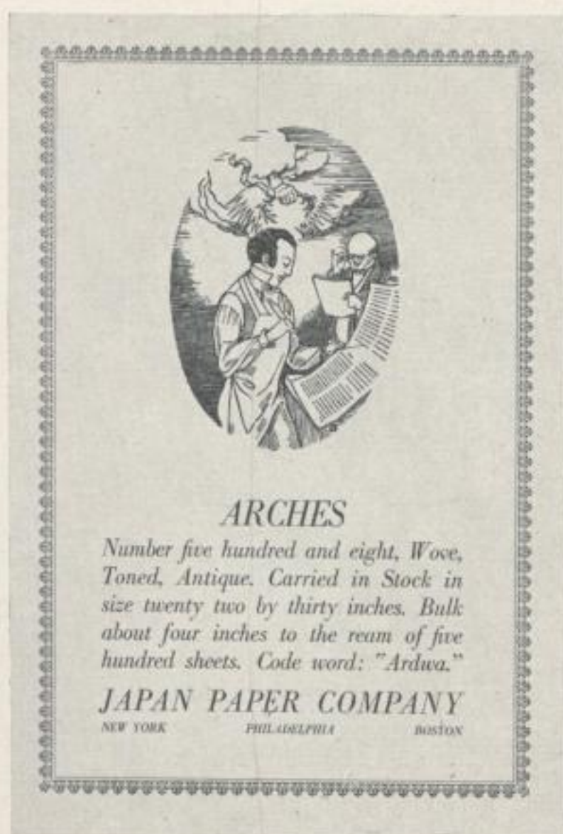
Entwurf und Druck von Designed and printed by The Cumberland Press

The names of the designers who arranged these successful and artistic pages are given under each illustration. They are all of them evidence of a fine attitude in art and of a true cultivated taste.