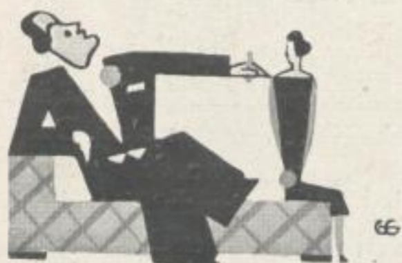
Illustrationen von GEORG GOEDECKER

(Beim Durchblättern einer illustrierten Zeitschrift:) Wisset, ein erhabner Sinn legt das Schöne in »Das Leben« und er sucht es nicht darin. Schiller