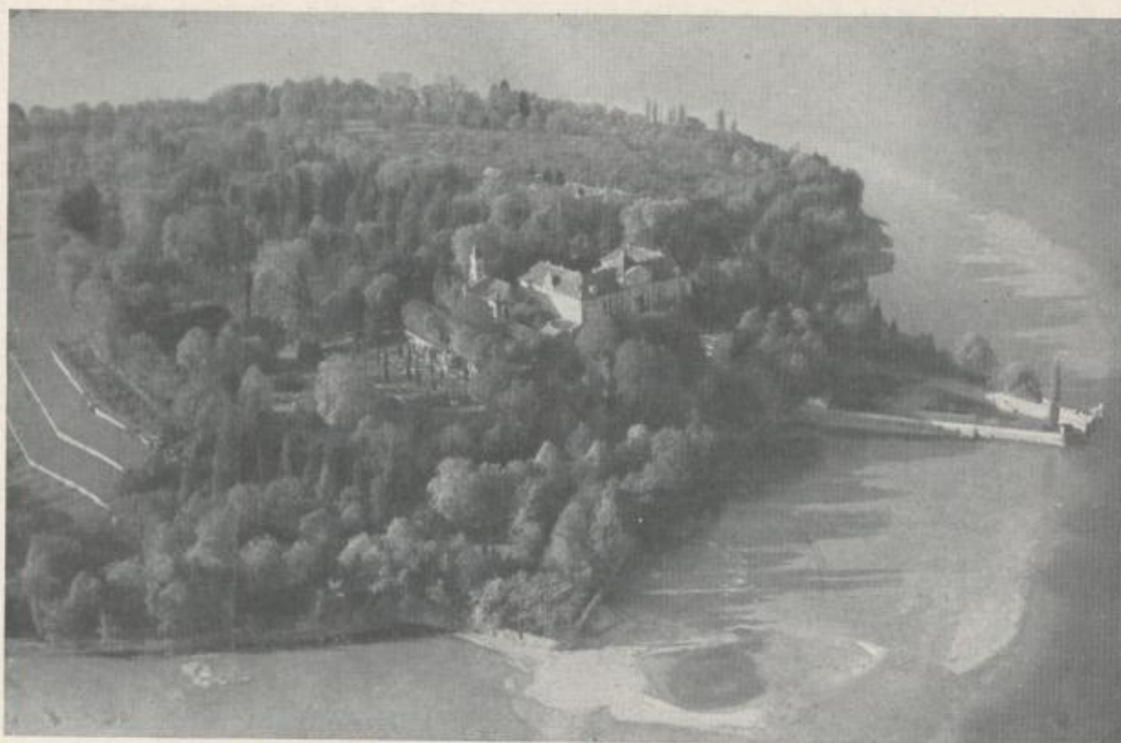
Flugzeugaufnahmen zu Reklamezwecken für Bäder und Luftkurorte

neu und schon deshalb wirkungsvoll zu sein, besitzen.