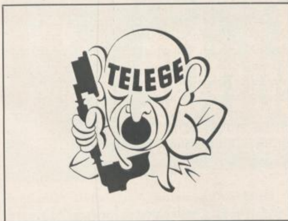
REKLAMEWERKSTATTEN SCHREIBER, BIELEFELD

Für Trostpreise und Ankäufe wurden die Entwürfe ausgesucht, die nächst den Preisträgern den Bedingungen am besten – insbesondere in künstlerischer Beziehung zu genügen schienen, während die Ankäufe zur Verwendung für allgemeine Werbezwecke ausgesucht wurden.