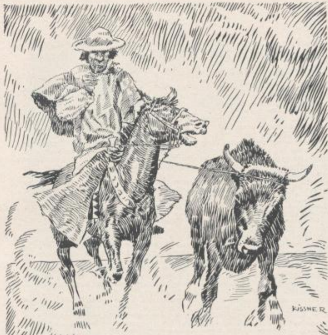
Die Bruderschaft der Zigaretten-Raucher ist über die ganze Welt verbreitet. Auch dem Gaucho auf den Pampas von Argentinien