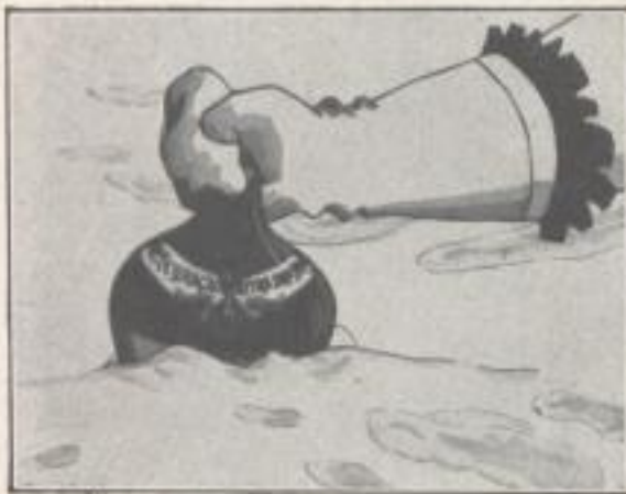
Ist dieser kostbare Likör zu finden.