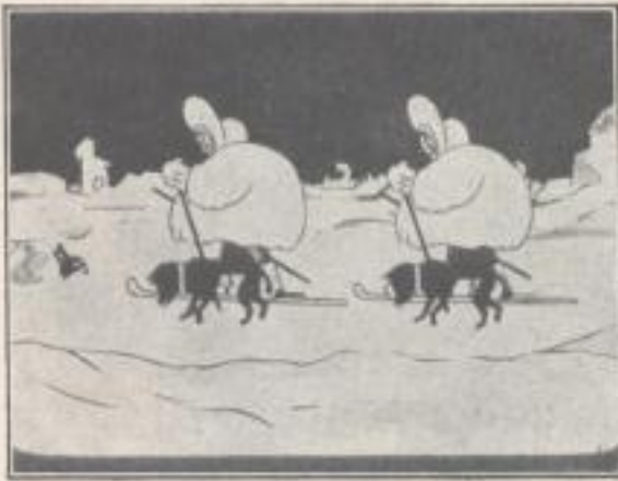
Selbst in den eisigen Gefilden der Arktis

Aus unserem Werbekurzfilm: „Flaschenpost“