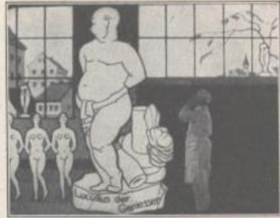
Wenn der Bildhauer einen so mächtigen Koloß geschaffen hat, darf er sich wohl eine Zigarre gönnen.

Aus unserem Werbekurzfilm: „Lucullus der Genießer“