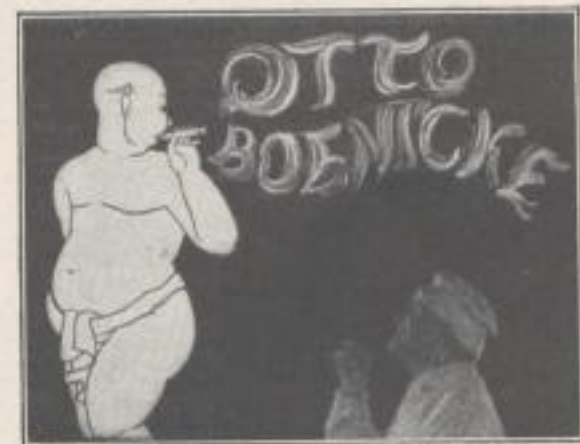
den Kundigen kunstvolle Rauchringe blasen

WERBEKUNST EPOCHE REKLAMEGES. M. B. H. DAS DEUTSCHE GROSSUNTERNEHMEN FÜR KINOREKLAME WERBEFILM LICHTBILD