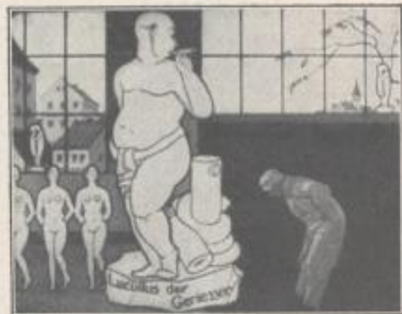
und der zurückkommende Bildhauer sieht