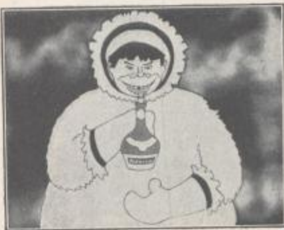
Bardinet erhältlich in der ganzen Welt!