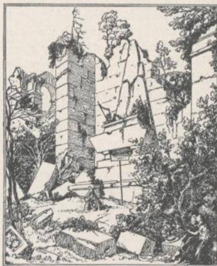
Entwurf A. BENUA Design

position, conscious limitation in the print chosen, that is to say, everything concentrated in the simplest possible lines. All the artists belonging to this movement — N. Kuprejanoff, A. Dejneka, J. Pimenoff, W. Konaschewitsch, G. Berendgoff etc. — accentuate only one specific moment in their conception of the task in hand, one aspect of their artistic individuality.