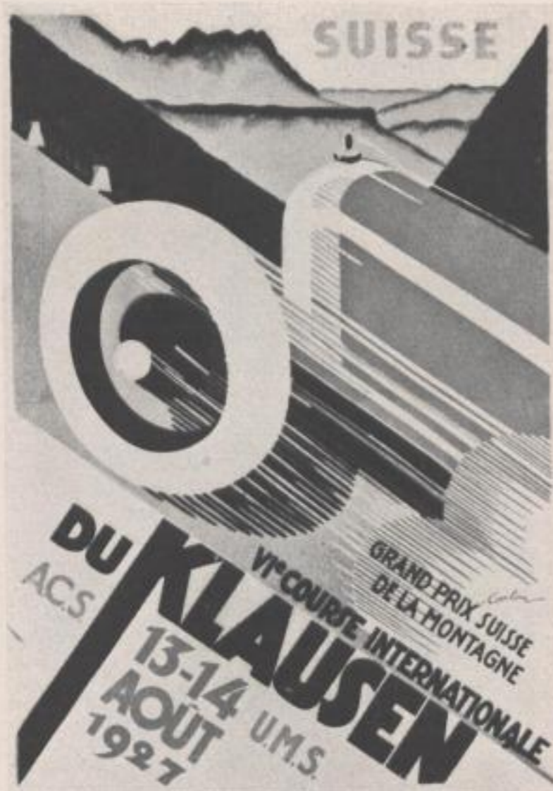
PLAKAT FÜR AUTORENNEN POSTER FOR RACE OF MOTORCARS