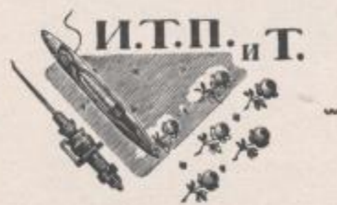
Holzschnitt / Woodcut Vignette

to the concentration of all form. But Favorsky's further creation is very far removed from the German woodcut. Before he found his own means of expression, he tried all the technical possibilities of the woodcut. All technical possibilities are always closely connected with purely formal problems, and these again are connected with ideal-artistic problems. Favorsky has discovered his