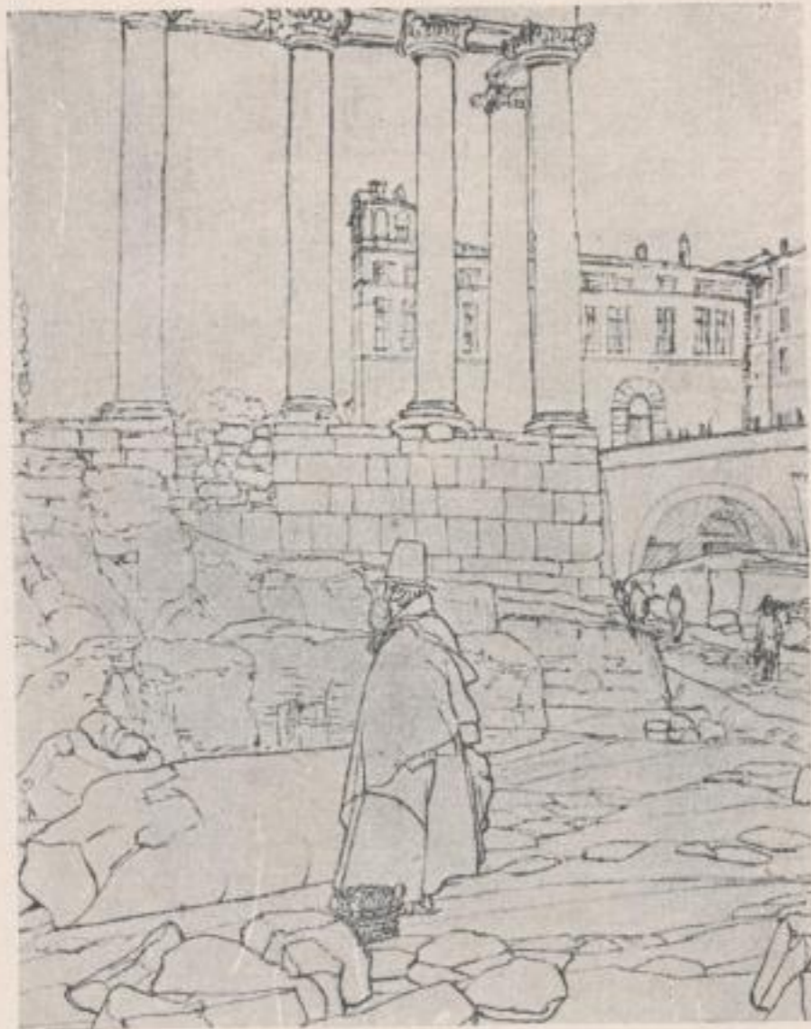
Forum Romanum (1839)