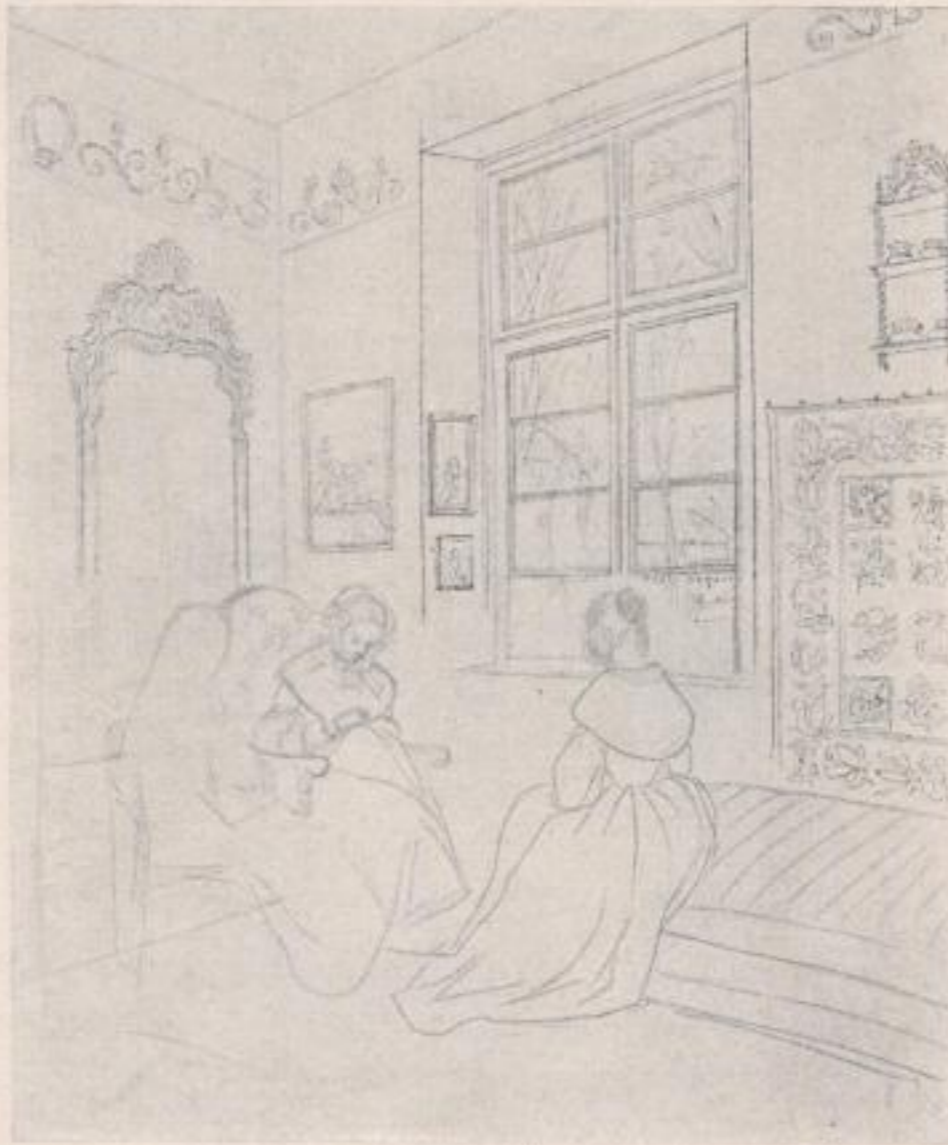
Aus dem Skizzenbuch von 1840