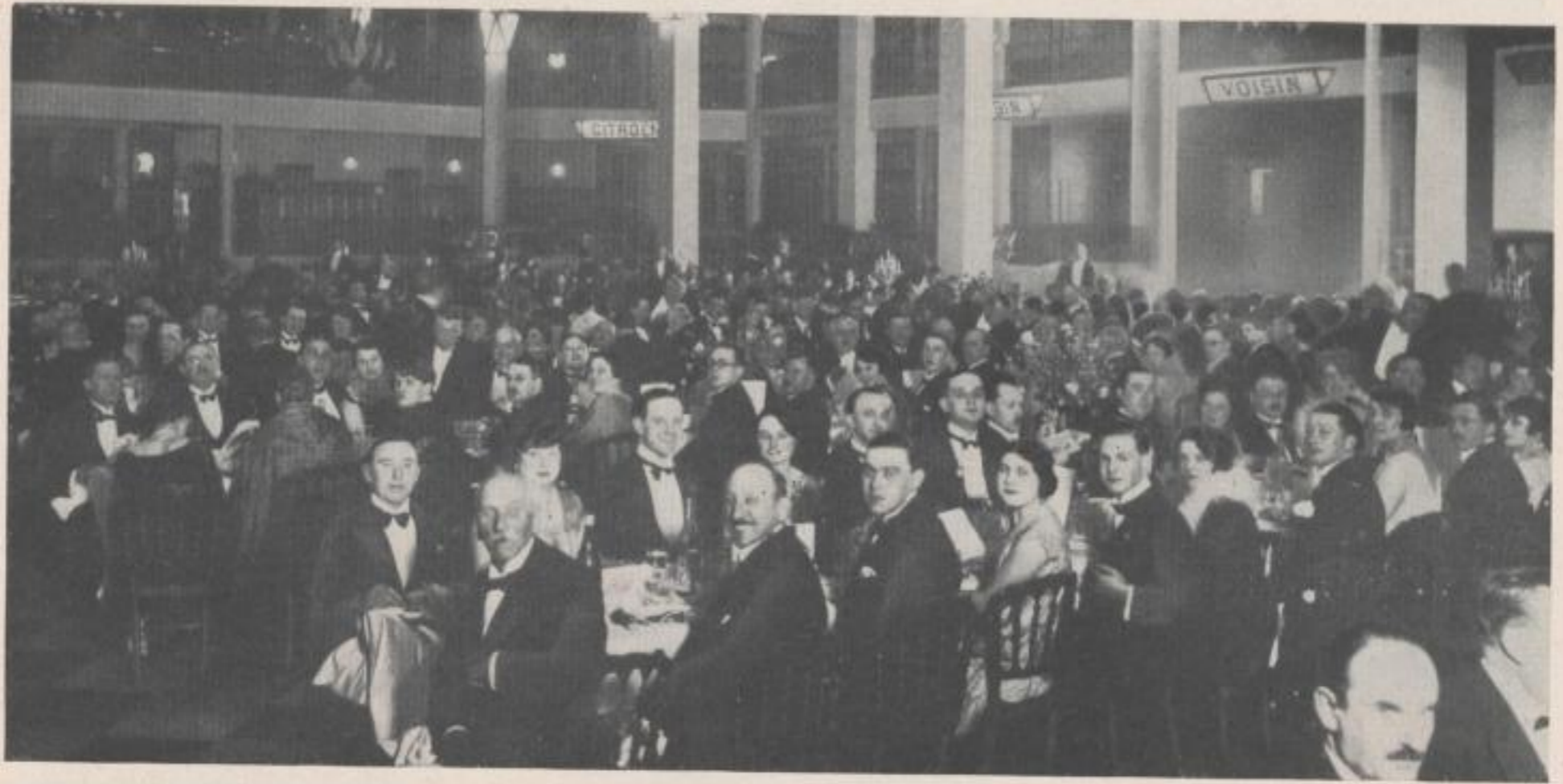
Das große Fest-Bankett unter Vorsitz des Kultusministers Herriot