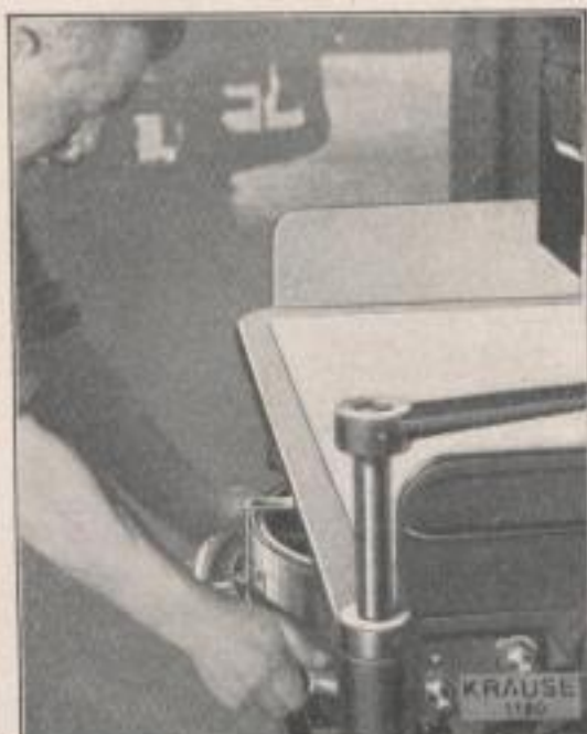
Der leicht zu handhabende KRAUSE-Schnellsattel. Der Schnellschneider A-H wird auch mit automatischem Vorschub und maschinellem Sattel-Vor- und Rücklauf geliefert. Modell A-H ist lieferbar in den Schnittlängen von 104, 115, 130, 150 und 165 cm

28 KRAUSE-Schnellschneider, Modell A-H, wurden in einer Woche bestellt, 100 in einem Monat, 380 im ersten Verkaufsjahr.