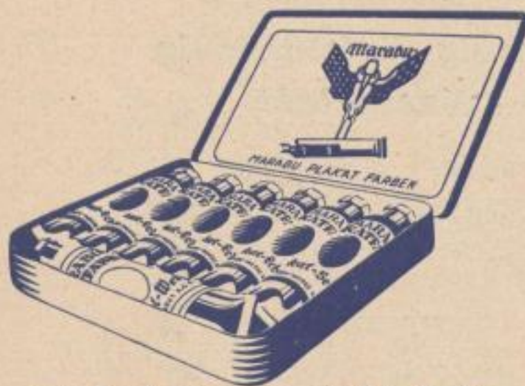
750/7 K mit 6 Tuben II und 1 Tube Weiß III