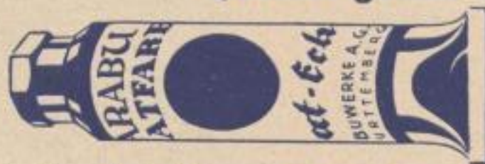
1/2 Tuben Sorte II . . . . . 1 Stück RM. —.20

Qualität genau wie die Original-Marabu-Plakatifarben