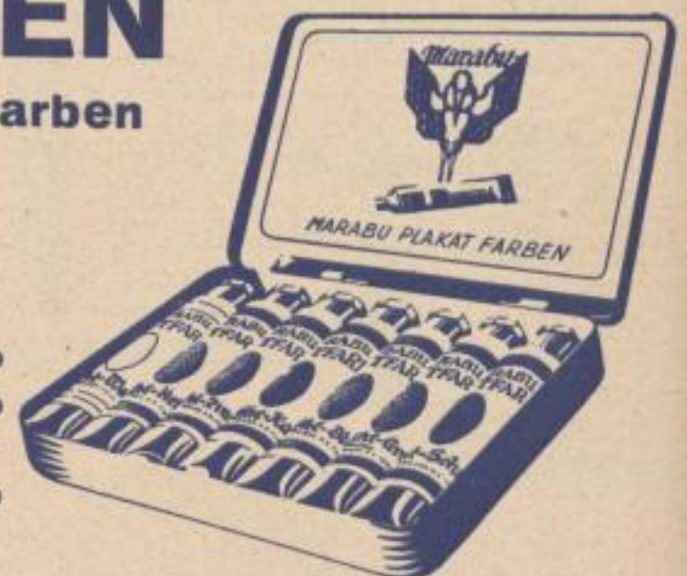
750/7 mit 7 Tuben III