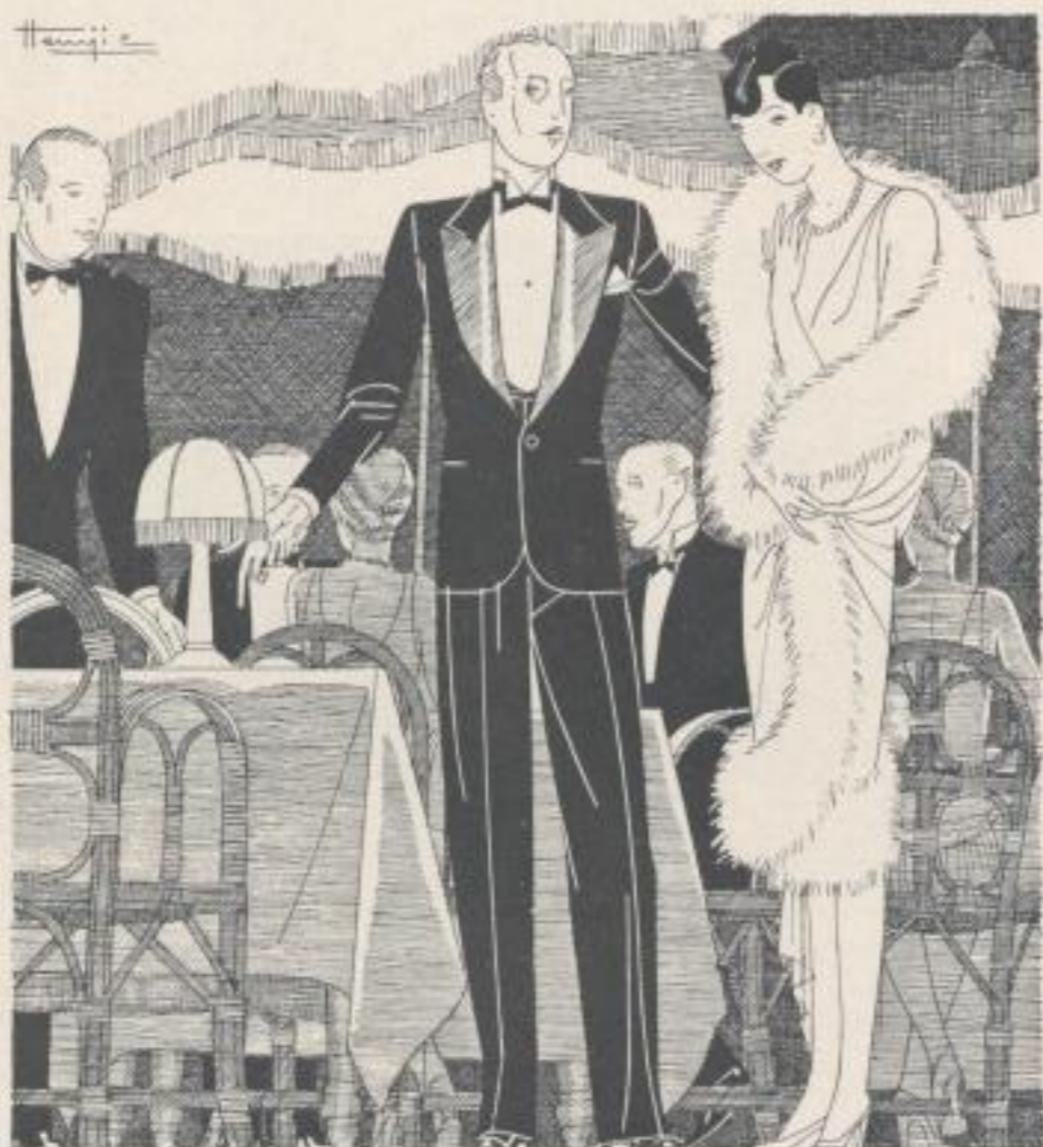
Illustrationen für Sports- und Modezeitschriften