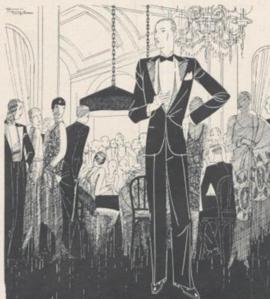
Illustrations for Sportings- and Fashion-Magazines