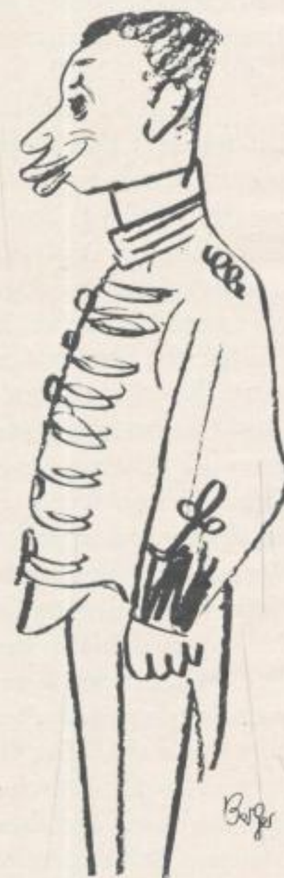
Der Boy vom »Capitol«