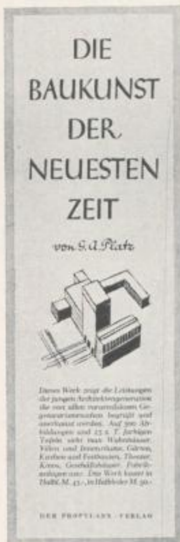
Inserat / Advertisement

number of individuals. The important thing is that this man in no way imitates an American. Although it is quite possible that he would get on well in America, this man could never have come out of America. This fact is of documentary importance. In ten years from now, anyone who wants to know how the commercial artists in Germany have become what they are, will find the causes of the development in the illustrations, which accompany this article.