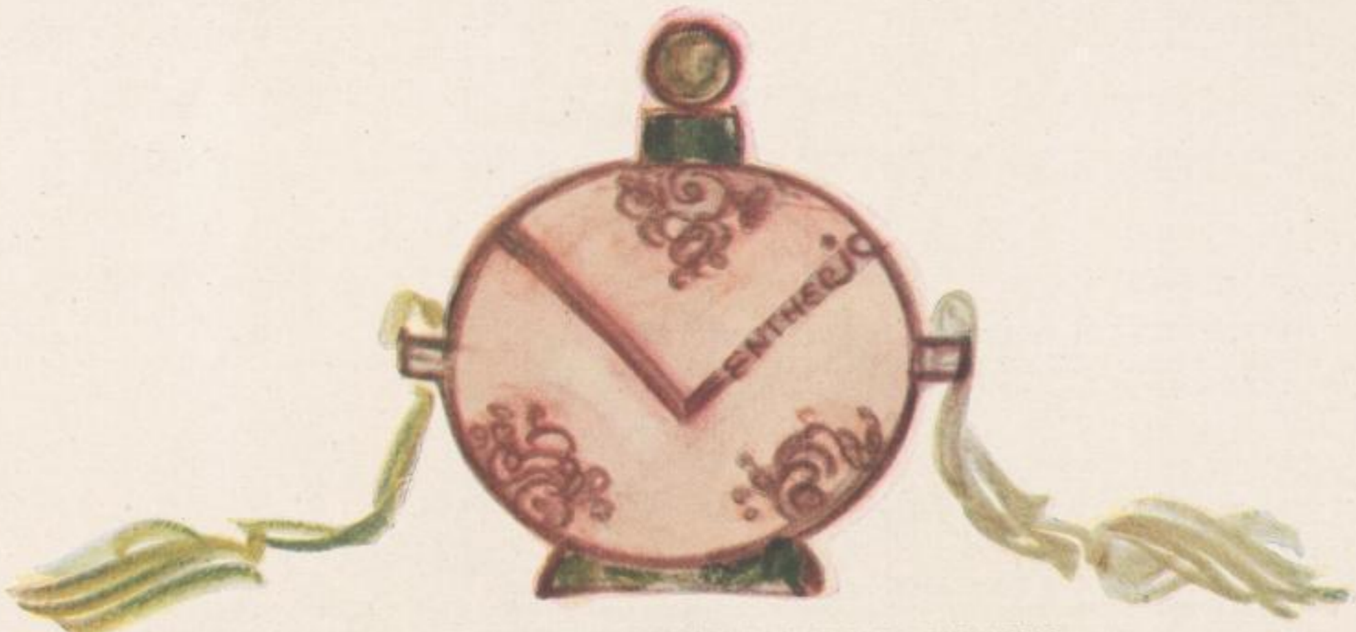
ENTWURF FÜR EINE PARFUMFLASCHE FÜR LENTHERIC DESIGN FOR PERFUME BOTTLE FOR LENTHERIC