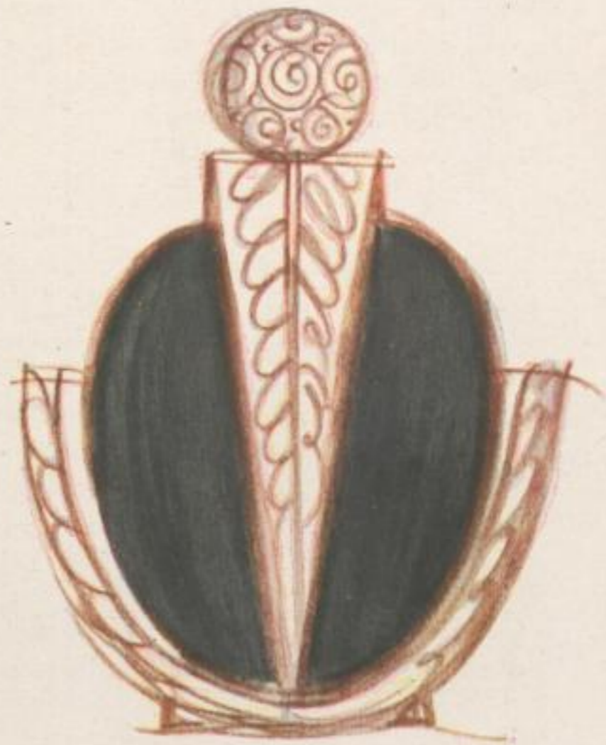
Im Lentheric-Wettbewerb erhielt dieser Entwurf den 2. Preis Awarded 2. Prize in Lentheric Perfume Bottle Contest