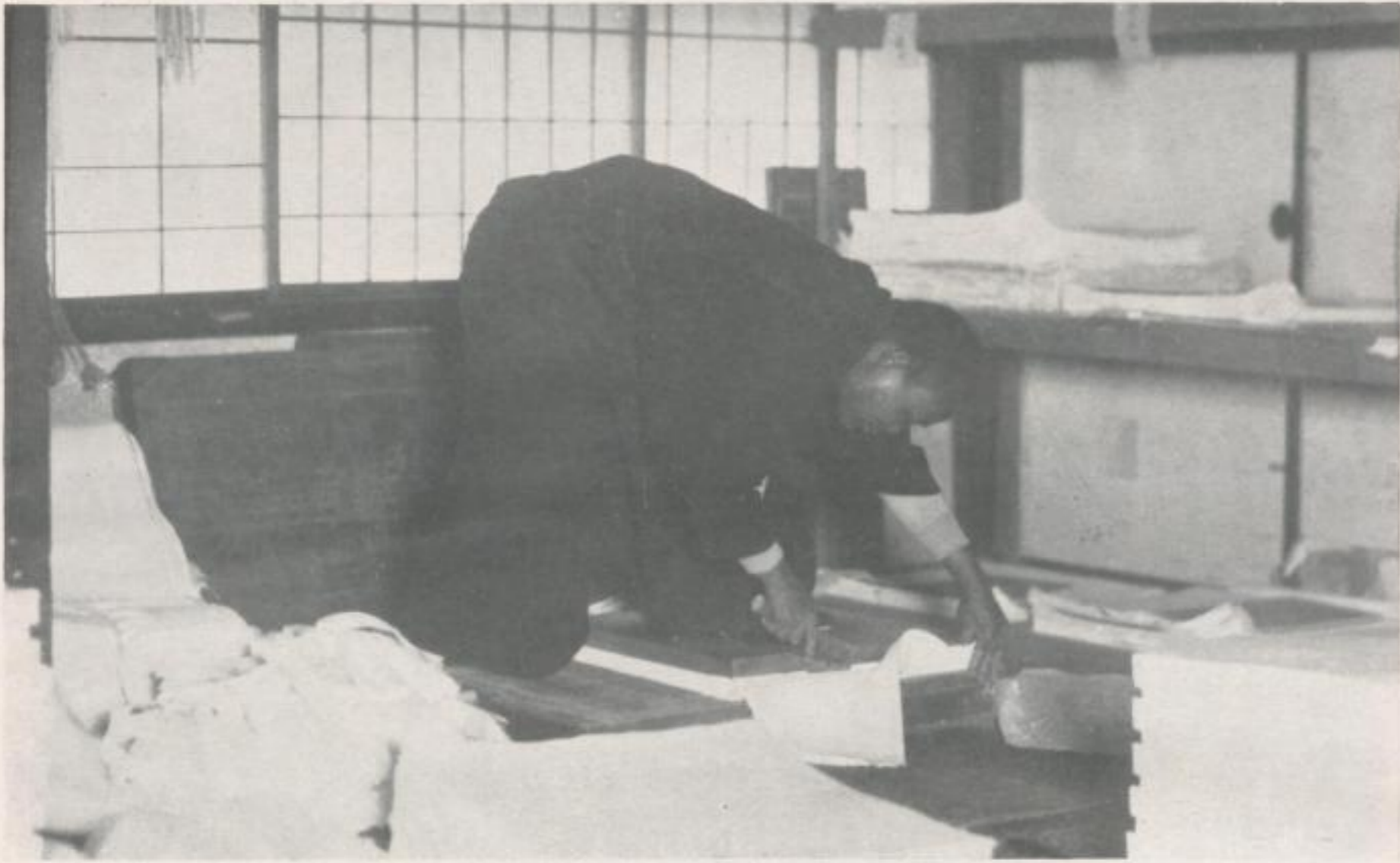
Das Schneiden des Papiers geschieht auf primitive Art. Etwa 500 Bogen werden aufeinandergelegt, mit einem etwa 10 cm dicken, schweren Holzbrett im Format des Bogens beschwert und von dem Arbeiter durch das Daraufsetzen des Fußes festgehalten. Mit einem scharfen Messer werden dann die ganzen 500 Bogen längs der Kante der Holzplatte durchgeschnitten The cutting of the paper is accomplished in a very primitive fashion. About 500 sheets are laid one above another, weighted down with a heavy plank of wood about an inch thick in the shape of the sheet of paper and held down by the workman's foot. The whole 500 sheets are then cut through at once along the edges of the wooden block with a sharp knife